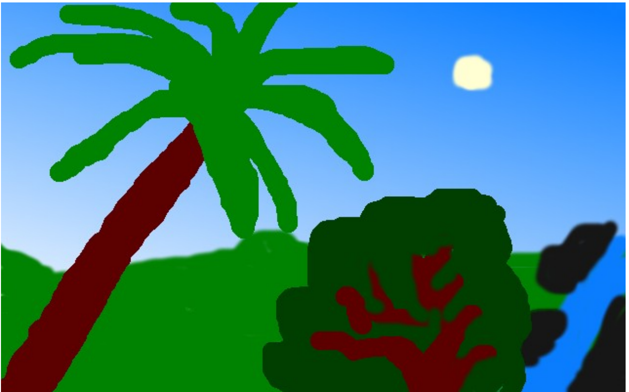
ആർഷാമോൾ എം റ്റി