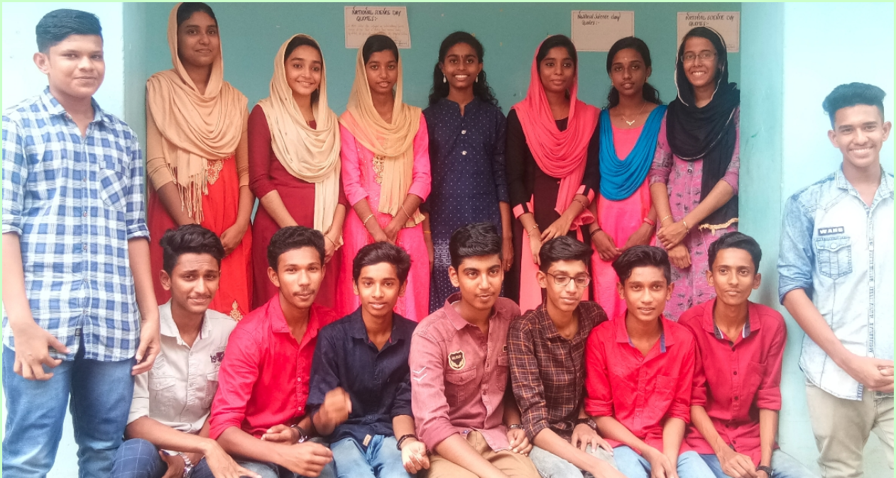
SSLC Full A Plus Students (2019 March)