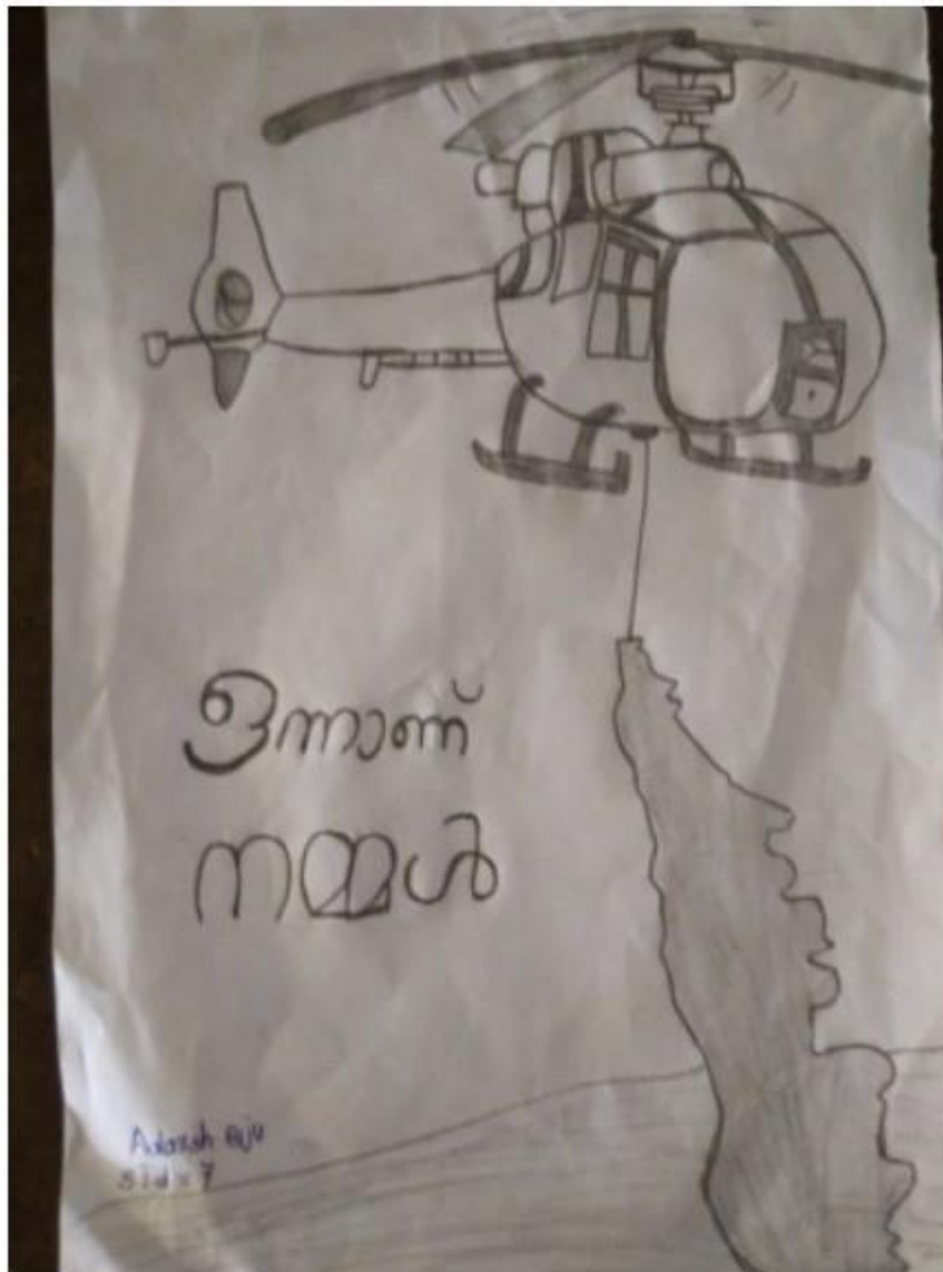
Art by Adarsh Biju VII A