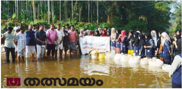
വിദ്യാർത്ഥികൾ തടയണ നിർമ്മാണത്തിൽ

അരിക്കോട് പഞ്ചായത്തിൽ ഏറ്റവും കൂടുതൽ കർഷകർ ഉള്ള ഒരു പ്രദേശമാണ് ഇത്. ഏപ്രിൽ, മെയ് മാസങ്ങളിൽ കടുത്ത ജലക്ഷാമം നേരിടുന്ന പ്രദേശത്തെ കൃഷിക്കാർക്കും കുടുംബങ്ങൾക്കും വിദ്യാർത്ഥികളുടെ ദൗത്യം വലിയ ആശ്വാസമാവും. അരിക്കോട്, ചീക്കോട്, കഴിമണ്ണ എന്നീ മൂന്ന് പഞ്ചായത്തുകളിലെ അഞ്ച് വാർഡുകളിലായി പരന്നുകിടക്കുന്ന 2500 കുടുംബങ്ങൾക്കാണ്