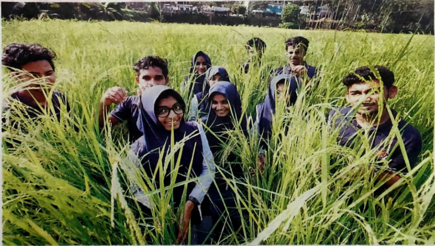
കരിണിയും കൃഗസകഗാല എന്നു വിളയുന്ന പാടത്ത് എസ്.ഒ.എച്ച്.എസ്.എസ്.എസ്.യിലെ കുട്ടികൾ

ട്രാക്ടർകൊണ്ട് ഉഴുതശേഷമുള്ള എല്ലാ മേലടികളും 'ടെം-ടേബിം' ഇവറ്റ് അവർതന്നെ ചെയ്തു. ഇപ്പോൾ പച്ച പിടിച്ചു നിൽക്കുന്ന ഈ പാടം ഫെബ്രുവരിയോടെ കൊട്ടാം. മാർച്ചിൽ പത്താംതരത്തിലെയും, പൂന്തട്ടുവിലെയും 'ചങ്കന്മാർക്ക്' യാത്രയയപ്പുനൽകുന്ന ദിവസം മുഴുവൻകുട്ടികൾക്കും ബീരിയാണി വെക്കാം.