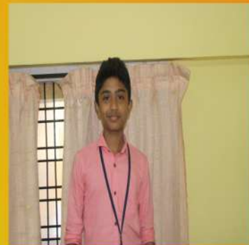
MEJO TOM VII A

I love my school It is a knowledge of pool Pool, pool, pool I love my school Here i met my friends so cool Cool, cool, cool I love my school We play and follow every rule Rule, rule, rule I love my school ,school, school It is a big knowledge pool Pool, pool, pool