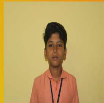
SHON JOMON IX B

May everyone forgive me for my deeds. May god open the gate for he to heaven! Amen.