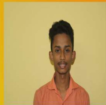
BINOTE X A

കണ്ടപ്പോൾ അച്ഛന് തൻറെ ഭാര്യയെ ഓർമ്മ വന്നു. അവൻറെ കണ്ണുകൾ സന്തോഷം കൊണ്ട് നിറഞ്ഞു. അവനു കൊടുക്കാനായി കുറെ പഴങ്ങൾ തൊണ്ടയിൽ നിറച്ചു കൊടുത്തു. അവൾ ആദ്യമായി കാടിറങ്ങി നാട്ടിലേക്ക് അതും കൊട്ടാരത്തിലേക്ക്. ദാസിയാായി അല്ല രാജകുമാരി ആയിട്ട്. പിന്നെ അവളെ കാണുന്നത് വിവാഹ വസ്ത്രം ധരിച്ചു വരുന്ന ഒരു വധു ആയിട്ടാണ്. വിവാഹമോതിരം അവർ പരസ്പരം കൈമാറി. പിന്നെ അവർ ഒരുമിച്ച് നൃത്തം ചെയ്തു. നൃത്തം ചെയ്തു കഴിഞ്ഞ് അവർ വിവാഹ വിരുന്നിനു വന്ന എല്ലാവരുടെയും ഇടയിൽനിന്ന് അവളോട് പറഞ്ഞു, ഇനിമുതൽ നീ അമ്മു അല്ല, 'ലോട്ട്സി' അവർ അവരുടെ ആദ്യ ചുംബനം അവിടെ കാഴ്ചവച്ചു.