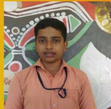
PRECIOUS PAUL IX A

പുകഴ്ത്തലിൽ വീണ കാക്ക പാടാനായി വാതുറന്നു. കടിച്ചു പിടിച്ചിരുന്ന അഷക്കുഷണം താഴെ വീണു. പെട്ടെന്നു തന്നെ കുറുക്കൻ അത് ചാടിപിടിച്ചു അകത്താക്കി. അവൻ ഒരു മുളിപ്പാട്ടും പാടി അവിടെ നിന്നു പോയി.