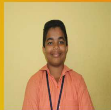
JINS BINU IX B

"you don't get it" my sister lovingly. "you flow for sake of others and that is not all after giving away so much, you offer whatever remains, to the sea. "on hearing that the river bowed down to the mountain and said with great enthusiasm, "you are absolutely right, my brother the true purpose of my life is to give life to other Thank you for your kind wisdom!" she said. While, the mountain smiled. At her new found positive energy. She gushed away with a loud gurgle feeling very happy.