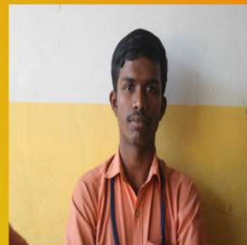
DANIEL DEEPU X A

She was the last best work of men and on her first voyogex was speeding-when out of the night loomed on ominous from of ghostly white she struck with a shaver from stem to stem and was rapidly sink to the darkness of the world disappearing for the world of wonder.