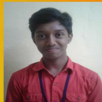
SOYAL SAJU IX A