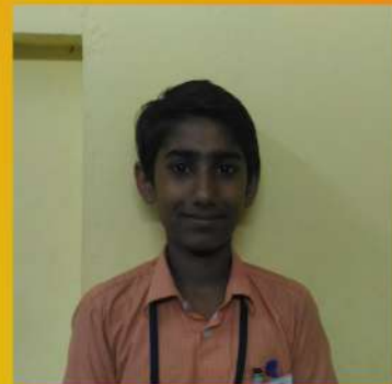
BESTIN BENNY IX A

“നിനക്കു വേണമെങ്കിൽ ചാടിക്കോ” മറ്റൊന്നും ആലോചിക്കാതെ ആട് കിണറ്റിലേക്ക് എടുത്ത ചാടി. ഉടൻ തന്നെ ആടിന്റെ മുതുകത്തു ചവിട്ടി കുറുക്കൻ പുറത്തേക്കു ചാടി. കരയിൽ നിന്ന് കിണറ്റിനകത്തേക്ക് നോക്കി പറഞ്ഞു. ആടേ എടുത്ത് ചാടി ഒന്നു ചെയ്യരുത്.