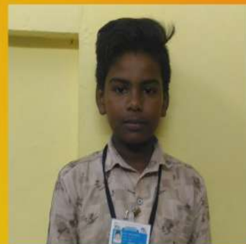
BOVAS APPOLA IX C

One day a tailor doing his work. A elephant come to his shop. The tailor give a banana to the elephant. All day the elephant to the tailor house. One day the elephant come to the tailor shop. The tailor not give a banana to the elephant. The tailor attack with a needle. The elephant was very angry. He water on the tailor..