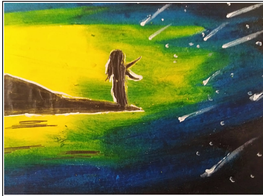
അന്നന്യ IX A