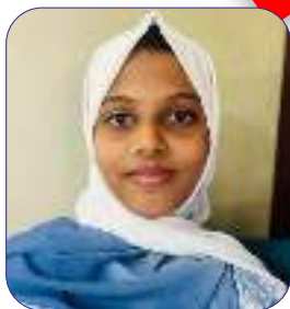
NAFEESATHUL MISIRIYA V