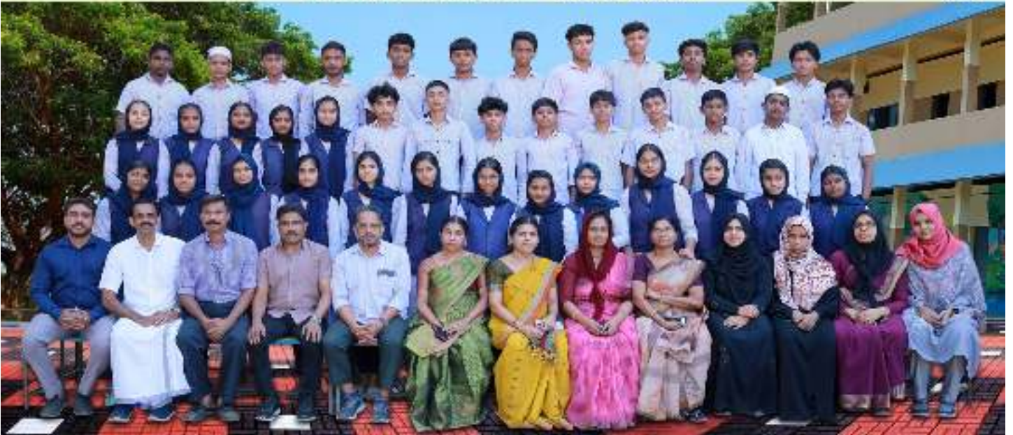
DUHSS THOOTHA SSLC 2023-24