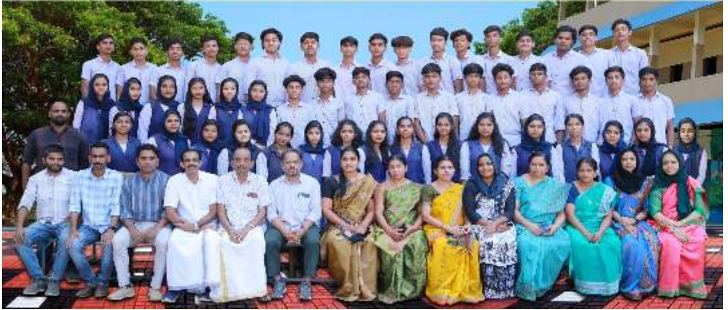
DUHSS THOOTHA SSLC 2023-24