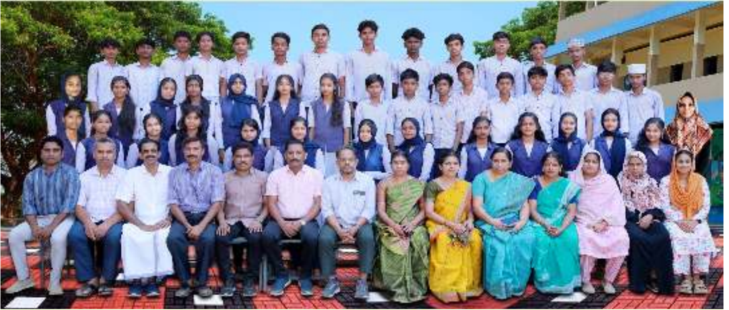
DUHSS THOOTHA SSLC 2023-24