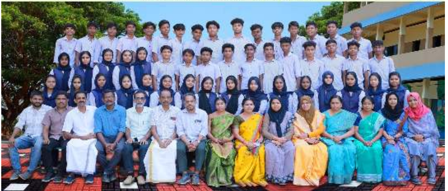
DUHSS THOOTHA SSLC 2023-24