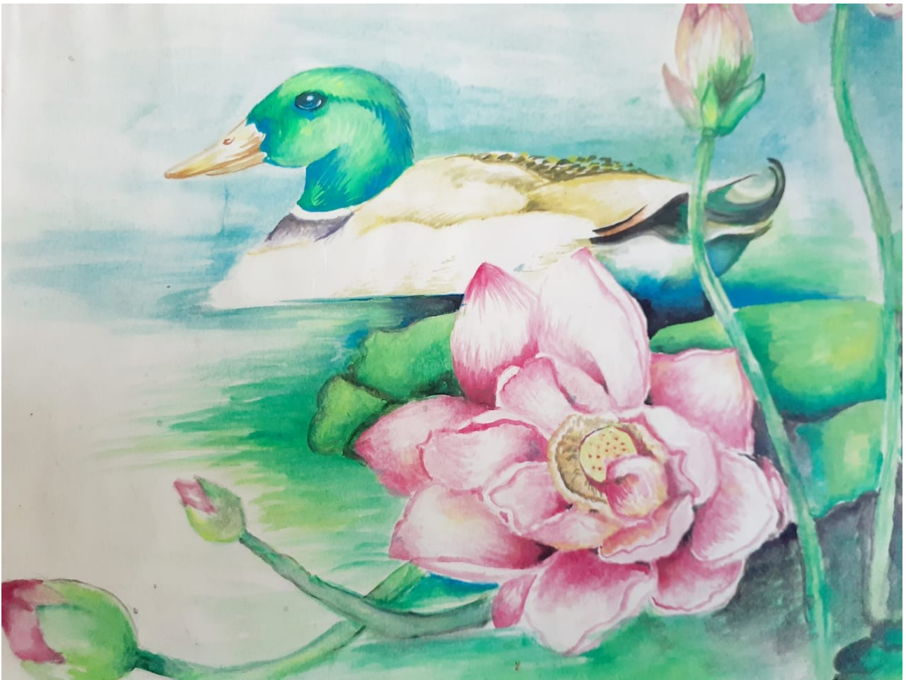
BY ABHISHEK BABU