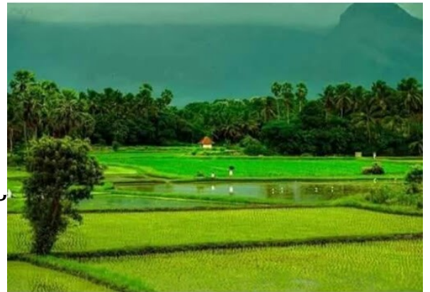
"നാട്ടിൻപുറം നന്മകളാൽ സമൃദ്ധം"

കേരളമാണെന്റെ നാട് മലയാളമാണെന്റെ ഭാഷ പച്ചപ്പുനിഞ്ഞ നാട് തെങ്ങുകൾ നിറയുന്ന നാട് സുന്ദരമാണെന്റെ നാട് ഇളം കാറ്റ് വീശുന്ന നാട് കേരളമാണെന്റെ സ്വന്തം നാട് കേരളം ദൈവത്തിന്റെ സ്വന്തം നാട് പൂക്കൾ നിറയുന്ന നാട് പെറ്റമ്മയാണെന്റെ നാട്