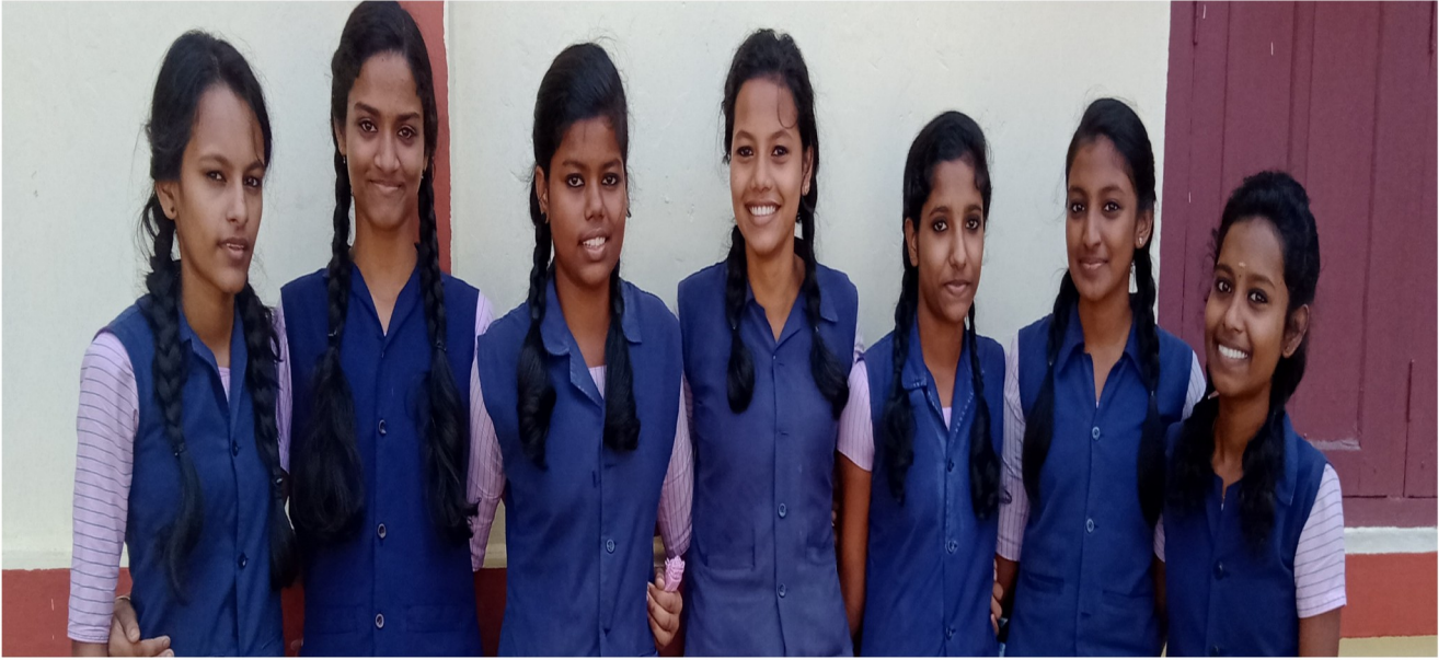
2019-20 SSLC batch

मिसाल है। इनके इस असल के साथ आगे बढ़कर एक साथ स्त्री संरक्षण के लिए लड़ना चाहिए।