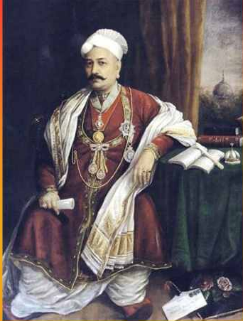
തിരുവിതാംകൂർ ദിവാൻജി സർ ടി. മാധവറാവു