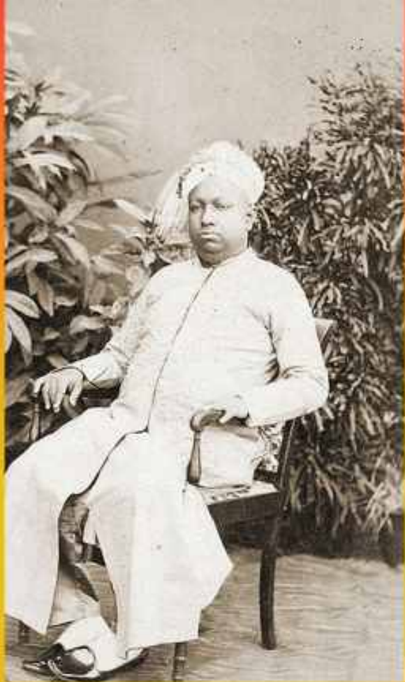
ആയില്യം തിരുന്നാൾ മഹാരാജാവ്