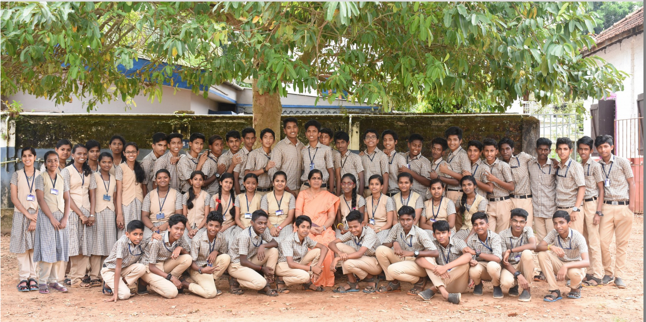
ഹൈസ്കൂൾ വിഭാഗം കലോത്സവ വിജയികൾ