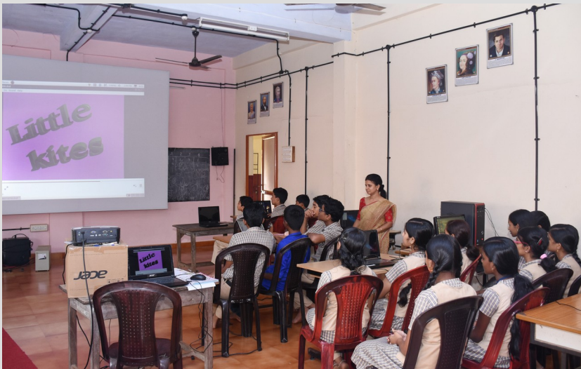
ലിറ്റിൽ കൈറ്റ്സ് ക്യാമ്പ്