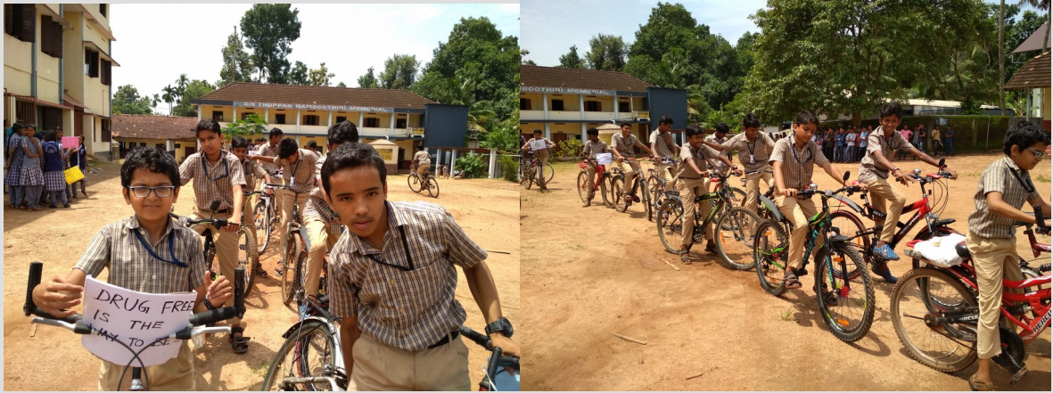
സൈക്കിൾ റാലി - മയക്കുമരുന്നെ് വിരുദ്ധ പ്രചാരണം