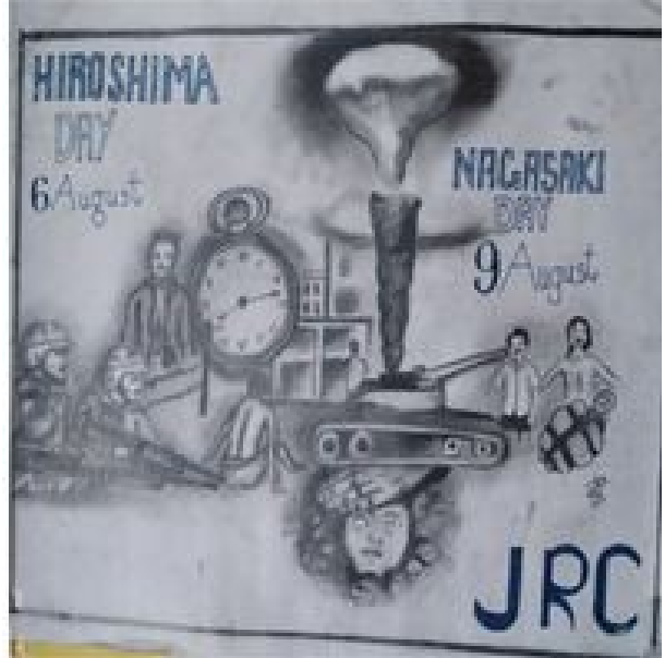
ഹിരോഷിമ ദിനത്തിൽ സംഗീത് വരച്ച ചിത്രം