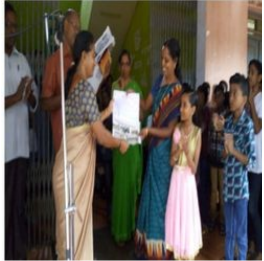
അധ്യാപക ദിനത്തിൽ കുട്ടികൾ തയ്യാറാക്കിയ കാർഡുകൾ