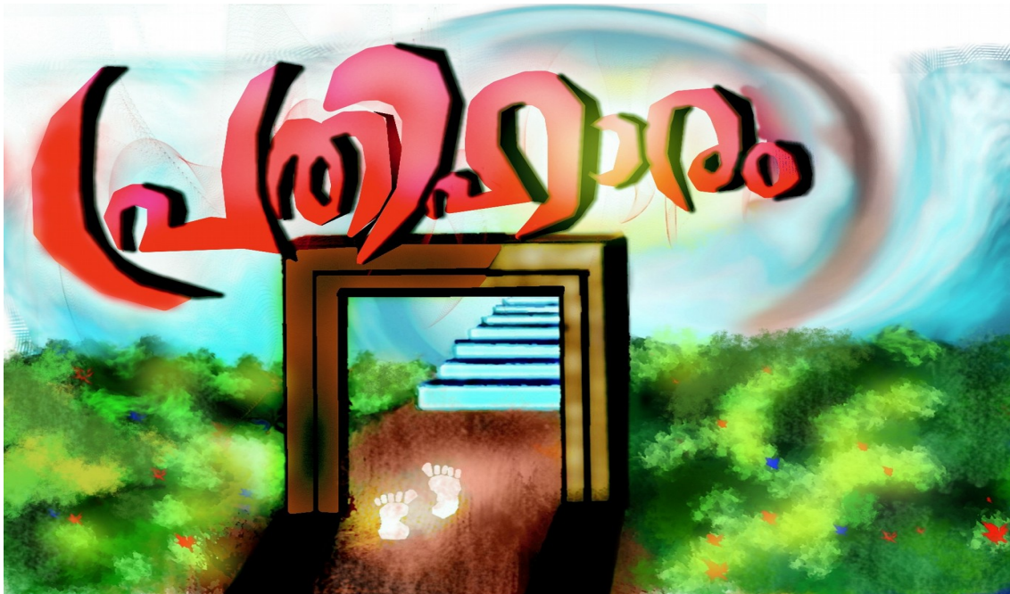
അക്കാദിക്ക് മാസ്റ്റർ പ്ലാനിനുവേണ്ടി സംഗീത് വരച്ച ചിത്രം