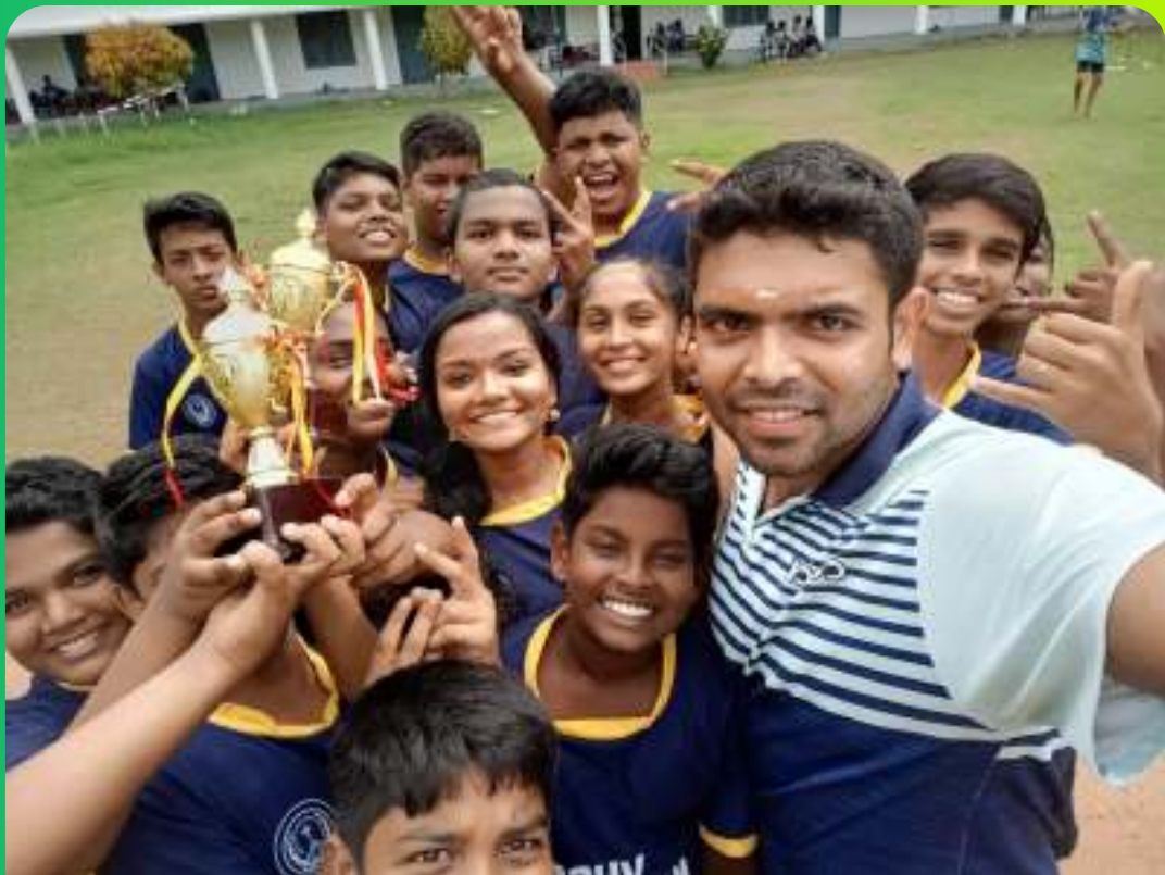
TUG OF WAR TEAM