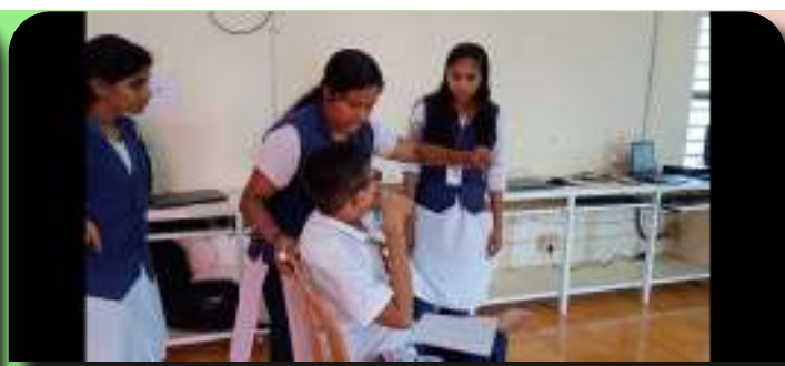
LK MEMBERS ASSISTING AJESH