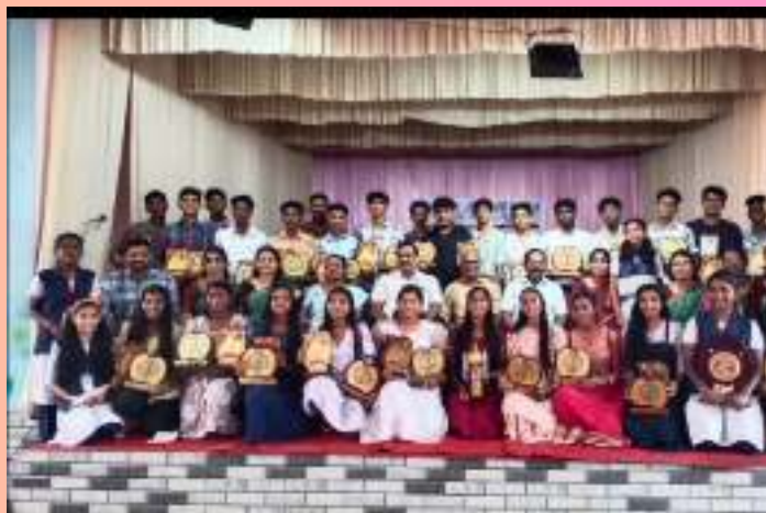
SSLC AWARD 2023

കഴിഞ്ഞ SSLC പരീക്ഷയിൽ നമ്മുടെ വിദ്യാലയം 100% വിജയത്തോടൊപ്പം 26 ഫുൾ A+ കളും നേടി