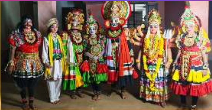
കേരള സംസ്ഥാന സ്കൂൾ കലോത്സവത്തിൽ HS വിഭാഗം യക്ഷഗാന മത്സരത്തിൽ A ഗ്രേഡ് നേടിയ നടവട്ടം വി എച്ച് എസ് എസ് ലെ കലാ പ്രതിഭകൾ

ജില്ലാതല മത്സരത്തിലേക്ക് കേരള നടനം (HS), മോണോ ആക്ട് (HS) ഗ്രൂപ്പ് ഡാൻസ് (HS) സംഘഗാനം (HS), മലയാളം പ്രസംഗം (UP) ശാസ്ത്രീയ സംഗീതം (HS), യക്ഷഗാനം (HS) എന്നിവ തിരഞ്ഞെടുക്കപ്പെട്ടു. ഇതിൽ യക്ഷഗാനം (HS) ഒന്നാം സ്ഥാനം നേടി സംസ്ഥാന തലത്തിലേക്ക് തിരഞ്ഞെടുക്കപ്പെട്ടു. സംസ്ഥാന തലത്തിൽ യക്ഷഗാനത്തിന് A ഗ്രേഡ് നേടി.