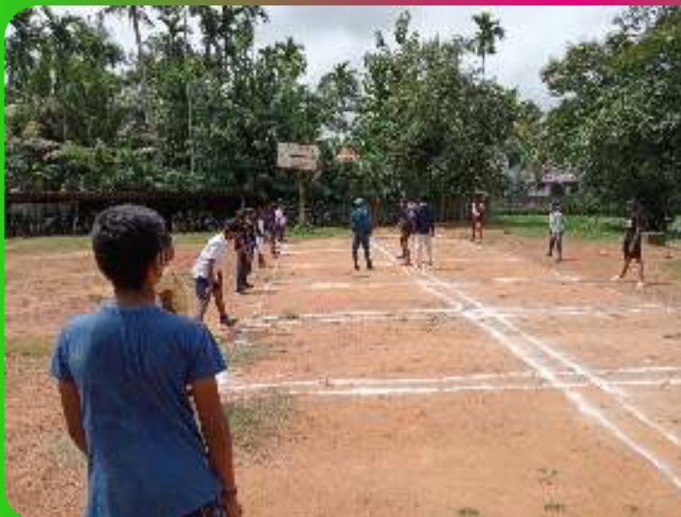
ആട്യ പാട്യ പരിശീലനം

ആട്യ-പാട്യ : ആലപ്പുഴ ജില്ലാ സബ് ജൂനിയർ ആട്യ പാട്യ ചാമ്പ്യൻഷിപ്പിൽ ഫസ്റ്റ് റണ്ണർ അപ്പ് ആവുകയും ജില്ലാ ചാമ്പ്യൻഷിപ്പിലെ പ്രകടന മികവിൽ ഏഴ് കായികതാരങ്ങൾക്ക് തൃശൂരിൽ നടന്ന സംസ്ഥാന ചാമ്പ്യൻഷിപ്പിലേക്ക് തിരഞ്ഞെടുക്കപ്പെടുകയും സംസ്ഥാന ചാമ്പ്യൻഷിപ്പിൽ ആലപ്പുഴജില്ലക്ക് വേണ്ടി മൂന്നാംസ്ഥാനം നേടാനും കഴിഞ്ഞു..