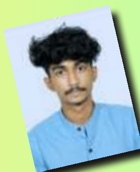
ദേവനാരായണൻ സ്കൂൾ ലീഡർ