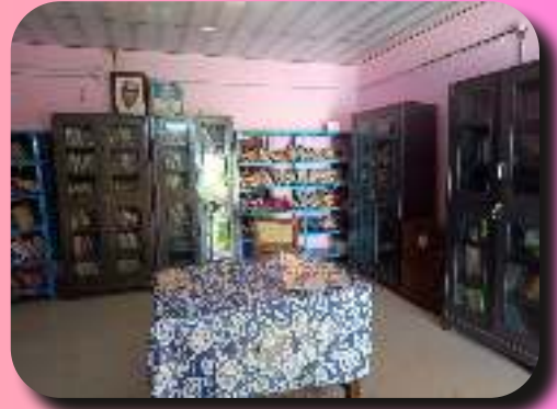
LIBRARY & READING ROOM

നമ്മുടെ വിദ്യാലയത്തിന്റേയും, നാടിന്റേയും അഭിവൃദ്ധിയും, ഐശ്വര്യവും, ക്ഷേമവും ലക്ഷ്യമാക്കി 2003 ഏപ്രിൽ 6ന് രൂപീകൃതമായ സ്കൂളിലെ പൂർവ്വ വിദ്യാർത്ഥികളുടെ സംഘടനയാണ് വരദ. വിദ്യാർത്ഥികൾക്ക് വിദ്യാഭ്യാസ സഹായങ്ങളും, അവാർഡുകളും നൽകി പ്രോത്സാഹിപ്പിക്കുന്നു. കേരളത്തിൻ്റെ സാമൂഹിക സാംസ്കാരിക വിദ്യാഭ്യാസ മണ്ഡലങ്ങളിലെ സമഗ്ര സംഭാവനക്കുള്ള "എ.പി.ഉദയഭാനു സ്്മാരക വരദ പുരസ്കാരം" ശ്രേഷ്ഠ വ്യക്തിത്വങ്ങളെ കണ്ടെത്തി നൽകി വരുന്നു