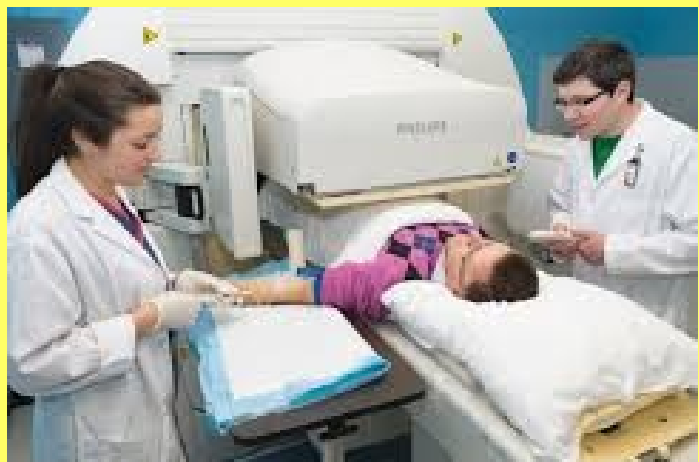
Nuclear Medicine & Molecular Imaging Technology

In the medical field science has lessened human suffering and it has increased the joys of life. Penicillin , x-ray ,biopsy and ECG etc. are the wonders of modern science. Doctors and patients cannot have a single day without these. In the past many people had died lacking of proper medical treatment. Then complicated medical treatment was not possible because the lack of scientific knowledge.