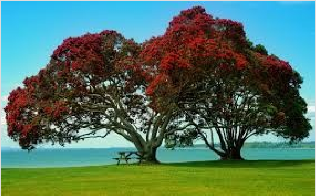
Rubabi R VIII B

Trees...Trees...Are Very Beautiful The Good Air And Good Food Are Gods Blessings Human and animals Like trees Tree..tree...tree Trees are the gift of God I love trees