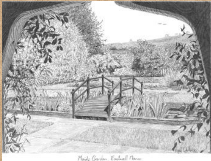
Mado Garden, Eochell Manor

പൂവുകൾ കണ്ടോ പുനോട്ടത്തിൽ പൂഞ്ചിരിതുകുന്നു തുമ്പികൾ കണ്ടോ പാറിപ്പാറി പൂവിലിരിക്കുന്നു പൂന്തേരണ്ടു മദിച്ചവരയ്ക്കു പൂഞ്ചിരിതുകി പുനോട്ടത്തിൽ പാറി നടക്കുന്നു