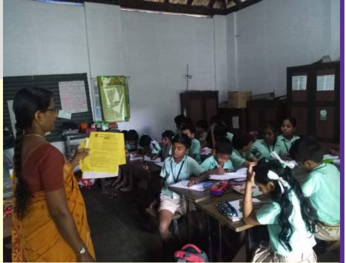
വിജ്ഞാനോൽസവ പരീക്ഷയിൽ നിന്നും