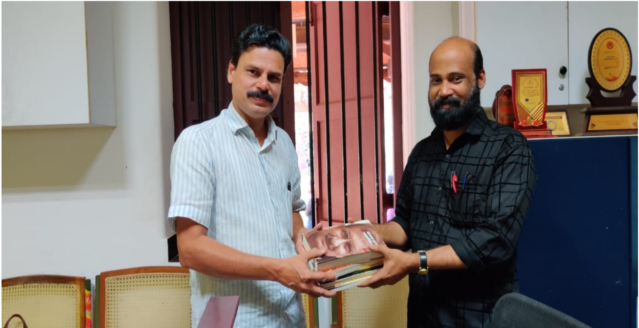
Contribution to library