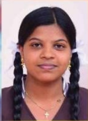
വർഷ.പി.എൽ HSS ശാസ്ത്രമേള – റിസർച്ച്പ്രൈമർ II

സംസ്ഥാന ശാസ്ത്രമേളയിൽ ഹയർസെക്കന്ററി വിഭാഗത്തിൽ ഒരു ഗ്രേഡെങ്കിലും ലഭിച്ച 121 സ്കൂളുകളിൽ അഞ്ചാം സ്ഥാനവും, തിരുവനന്തപുരം ജില്ലയിലെ സ്കൂളുകളിൽ ഒന്നാം സ്ഥാനവും വി.പി.എം.എച്ച്.എസ്.എസ് കരസ്ഥമാക്കി സംസ്ഥാന ശാസ്ത്രോത്സവത്തിൽ എ ഗ്രേഡ് നേടിയ പ്രതിഭകൾ