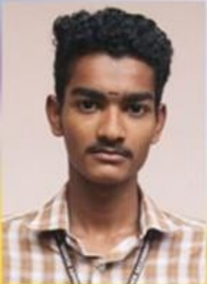
അഭികൃഷ്ണ.എ HS പ്രവൃത്തി പരിചയമേള ചിരട്ട കൊണ്ടുള്ള ഉൽപ്പന്നം