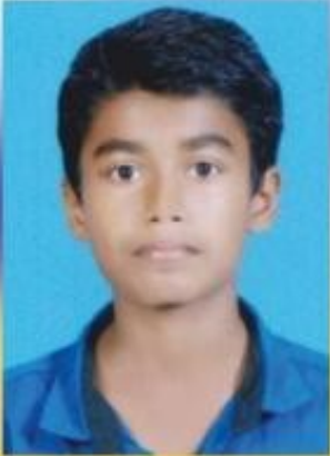
അതുൽ നോബർട്ട് HS പ്രവൃത്തി പരിചയമേള മെറ്റൽ എൻഗ്രേവിങ്ങ്