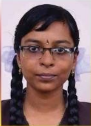
അഞ്ചന.എസ്. മോഹൻ HSS ശാസ്ത്രമേള – സ്റ്റീൽ മോഡൽ I