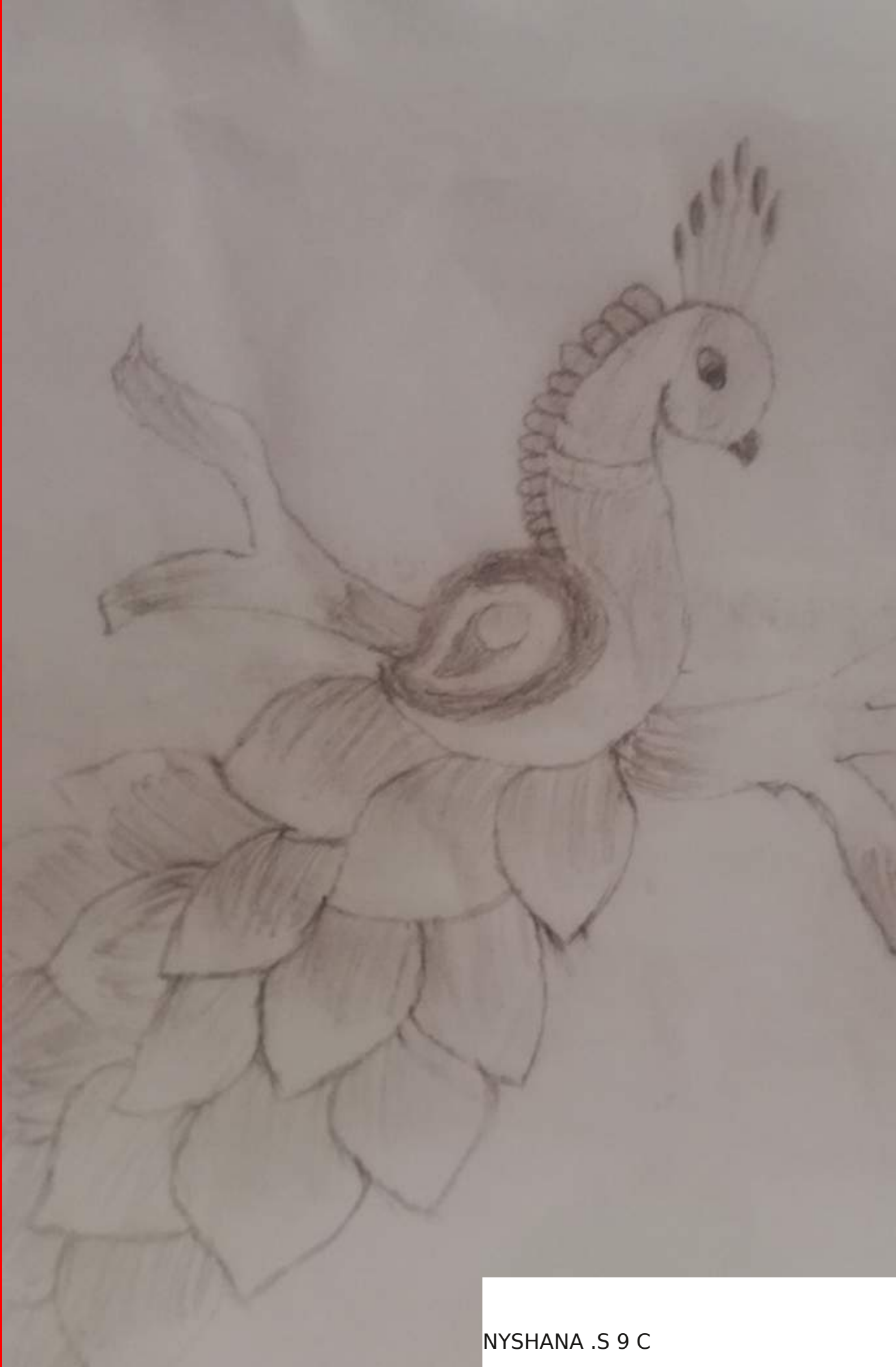
NYSHANA .S 9 C