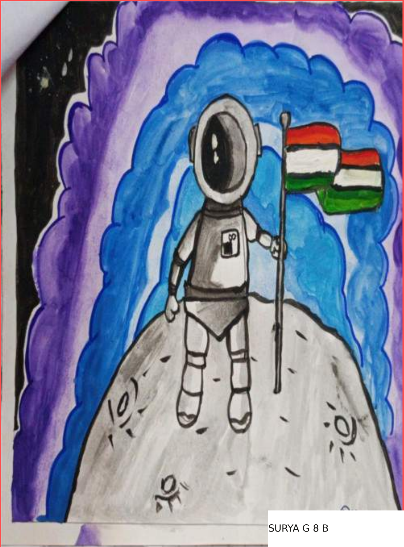
SURYA G 8 B