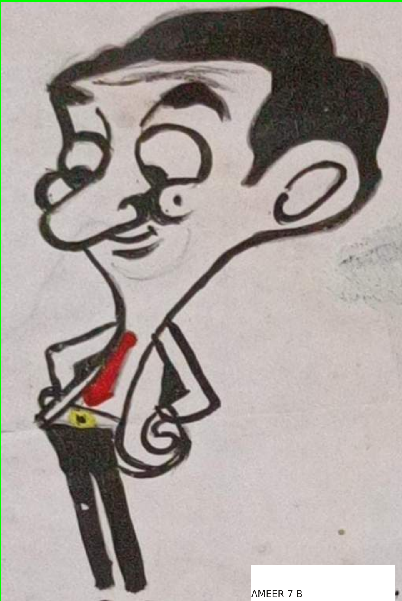
AMEER 7 B