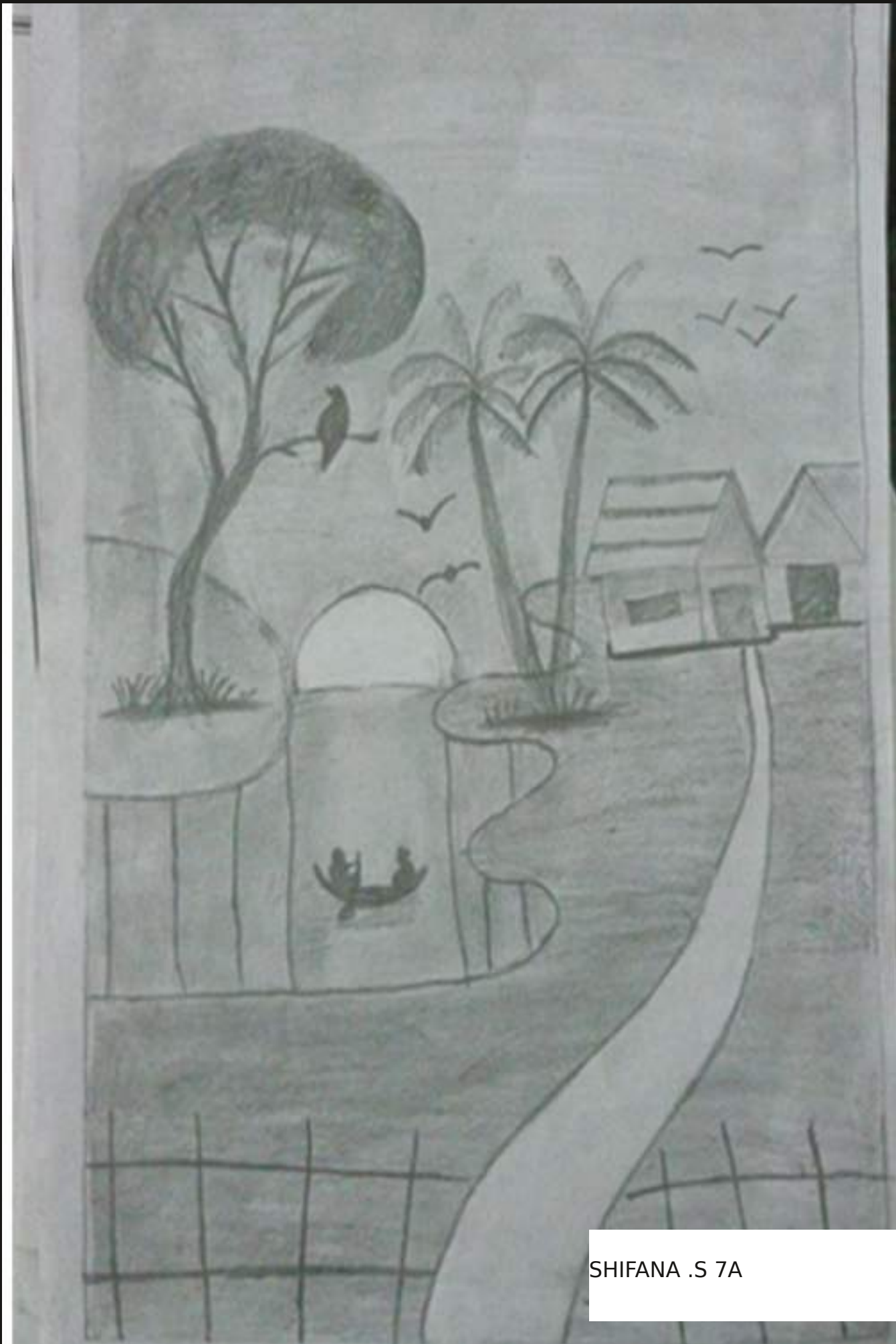
SHIFANA .S 7A