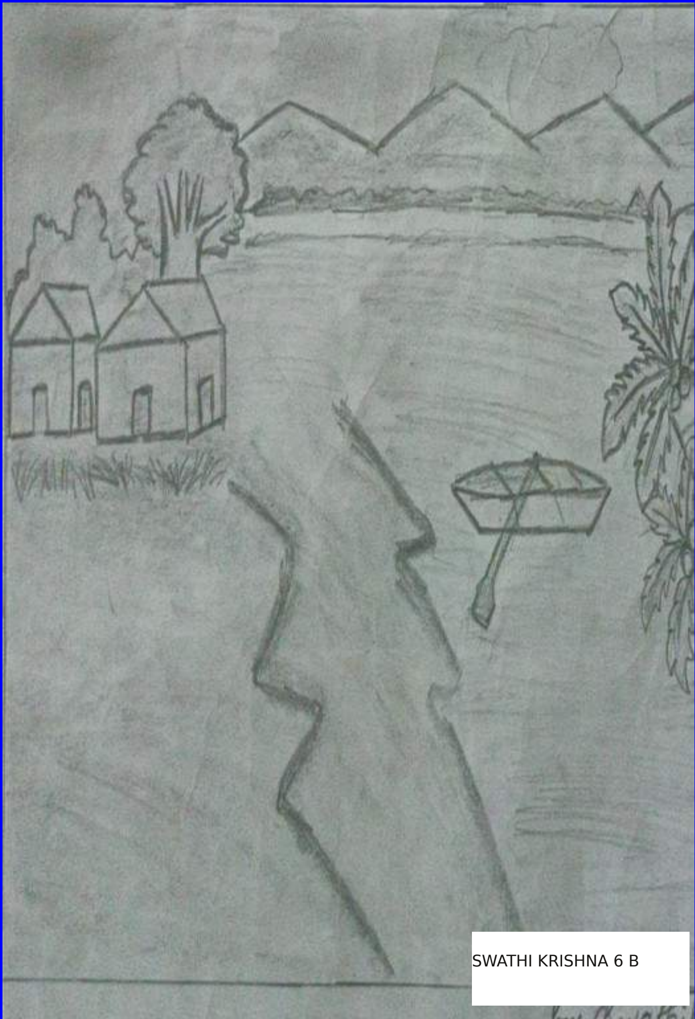
SWATHI KRISHNA 6 B