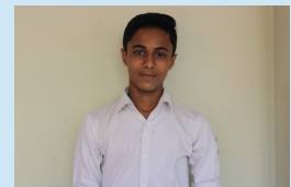
Abin Aby IX A

Tension!tension!tension! Children have tension about their examination parents,have tension about their children's admission grandparents have tension about their pension teachers have tension about their correction so there is always Tension! Tension! Tension!