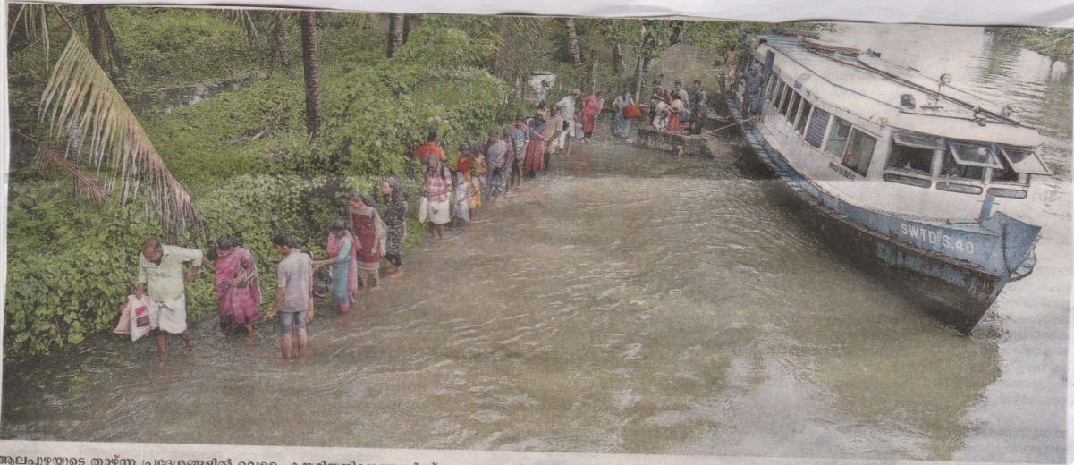
മുല്ലപ്പുഴയുടെ താഴ്ന്ന പ്രദേശങ്ങളിൽ വെള്ളം കയറിയതിനെത്തുടർന്ന് പങ്ങനാശേരിയിലേക്കു പോകാൻ കിടങ്ങു കെസി പാലത്തിനു സമീപം ബോട്ടിൽ വന്നിറങ്ങുന്നവർ. കെസി പാലത്തിന്റെ അടിയിലൂടെ ബോട്ടുകൾക്കു പോകാൻ കഴിയാത്തതിനാലാണ് ഇവർ പാലത്തിനു സമീപം ഇറങ്ങുന്നത്. പാലം കടന്ന് അടുത്ത ബോട്ടിൽ കയറിവേണം പങ്ങനാശേരിയിൽ എത്താൻ.