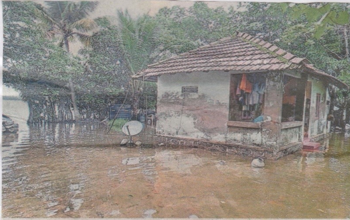
കൈതപ്പുഴ കായലിൽ ജലനിരപ്പ് ഉയർന്നതോടെ തൈക്കാട്ടുശേരി പഞ്ചായത്തിലെ ഒന്നാംവാർഡ് വളവരേരി പുഴക്കര പ്രദേശത്തെ വീടുകളിൽ വെള്ളം കയറിയപ്പോൾ.