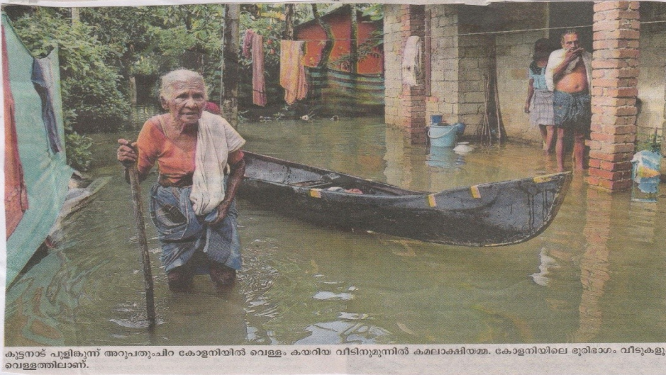
കൂട്ടനാട് പുളിങ്കുന്ന് അറുപതുചിറ കോളനിയിൽ വെള്ളം കയറിയ വീടിനുമുന്നിൽ കരലാക്ഷിയമ്മ. കോളനിയിലെ മുരിഭാഗം വീടുകളും വെള്ളത്തിലാണ്.