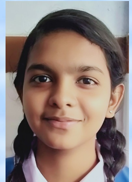
स्वजना मेरी नेलसण

इस छोटी जिन्दगी में आपस में झगटता हे मनुष्य सोचो मौत कभी भी आ सकता है और मनुष्य को ले जाता है ।