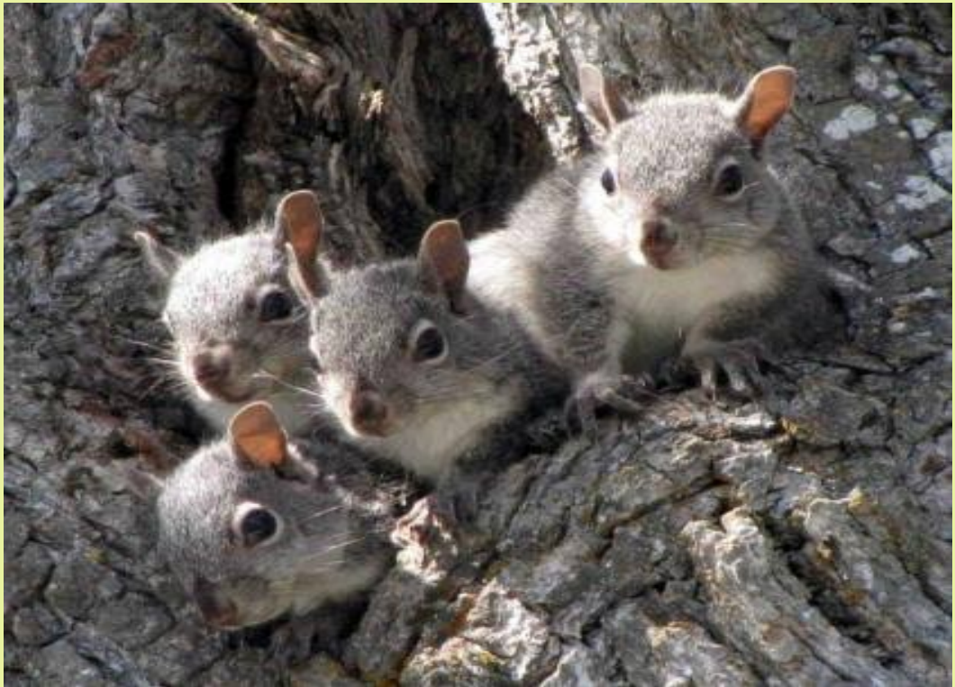
അഹമ്മദ് സിനാൻ വി വി