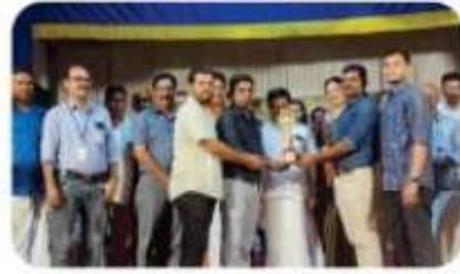
മെല്ലെ-2023-24 അധ്യയന വർഷത്തെ മെല്ലെ ഉപജീവ്യ അന്വീതമാണവത്തിൽ ജനാതികാര ഡിവിഷൻ അന്വീതമാണവത്തിൽ പാഠശാലാർ DUHSS ൽ വെട്ടാൻ അന്വീതമാണവം നേടി.