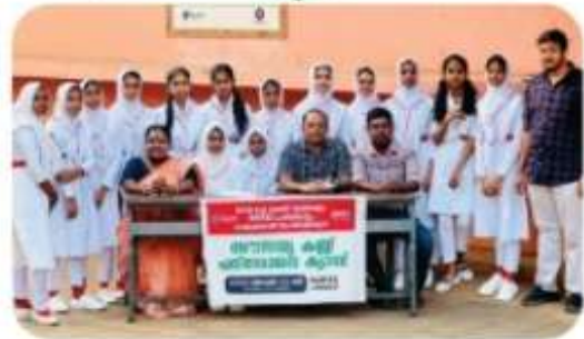
ഈയ്ക്ക് ഇല്ലം ഹൃദയം സൗകര്യം സ്പെഷ്യൽ ജനാതികാരം വാങ്ങലും സംയുക്തമായി സ്പെഷ്യൽ ക്യാമ്പസിൽ വെച്ച് സാജത് കണ്ണ് പരിരോധന ക്യാമ്പ് സംഘടിപ്പിച്ചു.