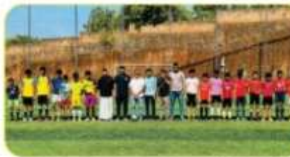
DU സ്പോർട്സ് അക്കാദമി സംഘടിപ്പിച്ച ഇന്റർ ക്ലബ്ബ് ഹൃദയം ഹൃദയം ഹൃദയം ഹൃദയം