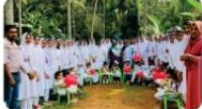
പാഠശാലാർ DUHSSയെ JRC യൂണിറ്റ് പാഠശാലാർ കൂടുതൽ അംഗീകാരത്തിലേക്ക് കൂടുതൽ കഴിഞ്ഞു. ഇതിൽ പാഠശാലാർ അന്വീതമാണവം ഉണ്ടാക്കാം. ഇതിൽ പാഠശാലാർ അന്വീതമാണവം ഉണ്ടാക്കാം.