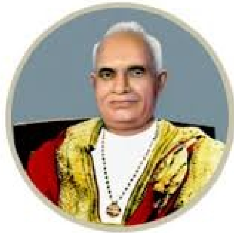
Padmabhushan Mannath Padmanabhan