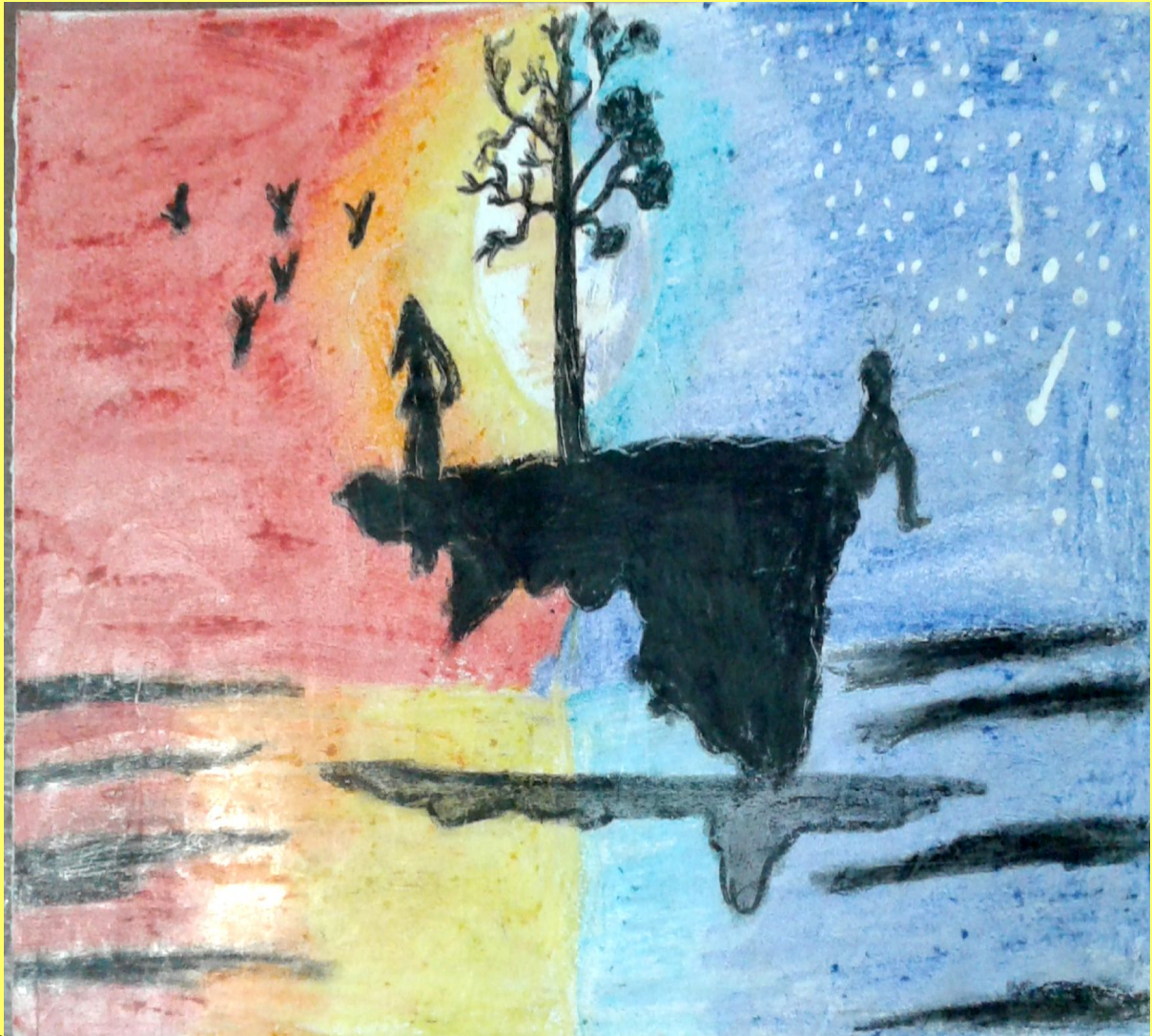
Generated by CamScanner