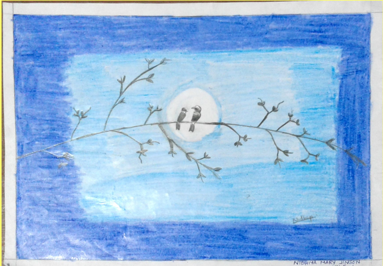
Generated by CamScanner