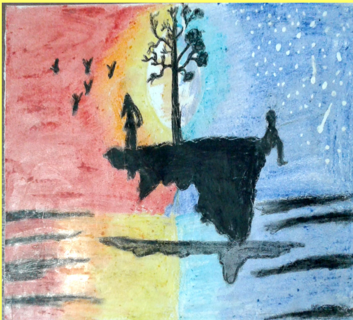
Generated by CamScanner