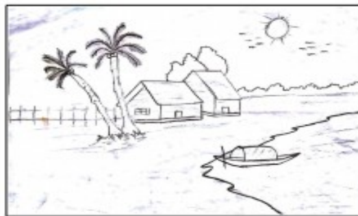
SABITH P VIII A