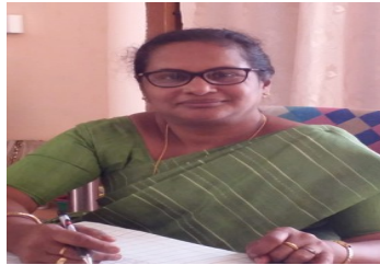
പ്രിയ ജേക്കബ് പ്രിൻസിപ്പൽ