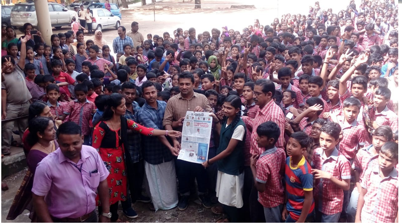
സൗജന്യ പത്രവിതരണം മാതൃഭൂമി