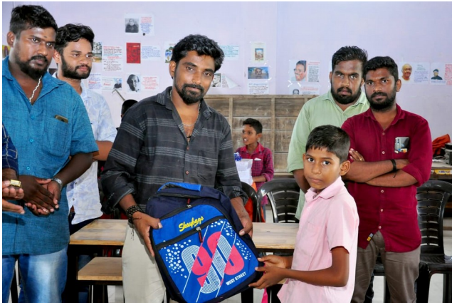
പഠനോപകരണവിതരണം - പൂർവ്വ വിദ്യാർത്ഥികൾ