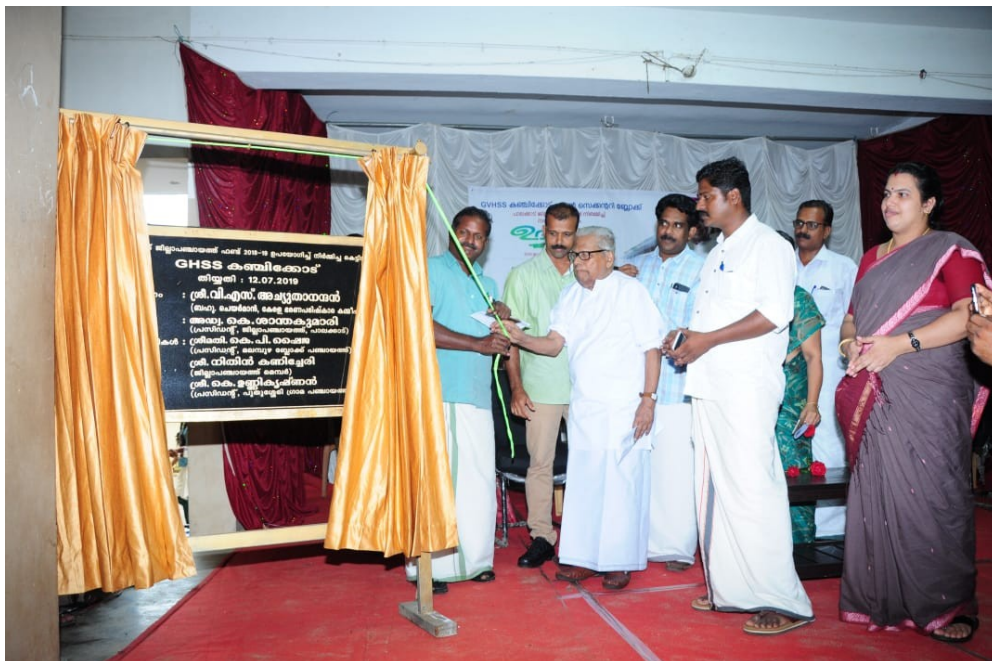
ഹയർസെക്കണ്ടറി പുതിയ മന്ദിരോദ്ഘാടനം ബഹു ശ്രീ വി എസ് അച്യുതാനന്ദൻ