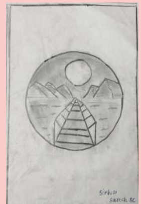
Sirishu Suresh, EC