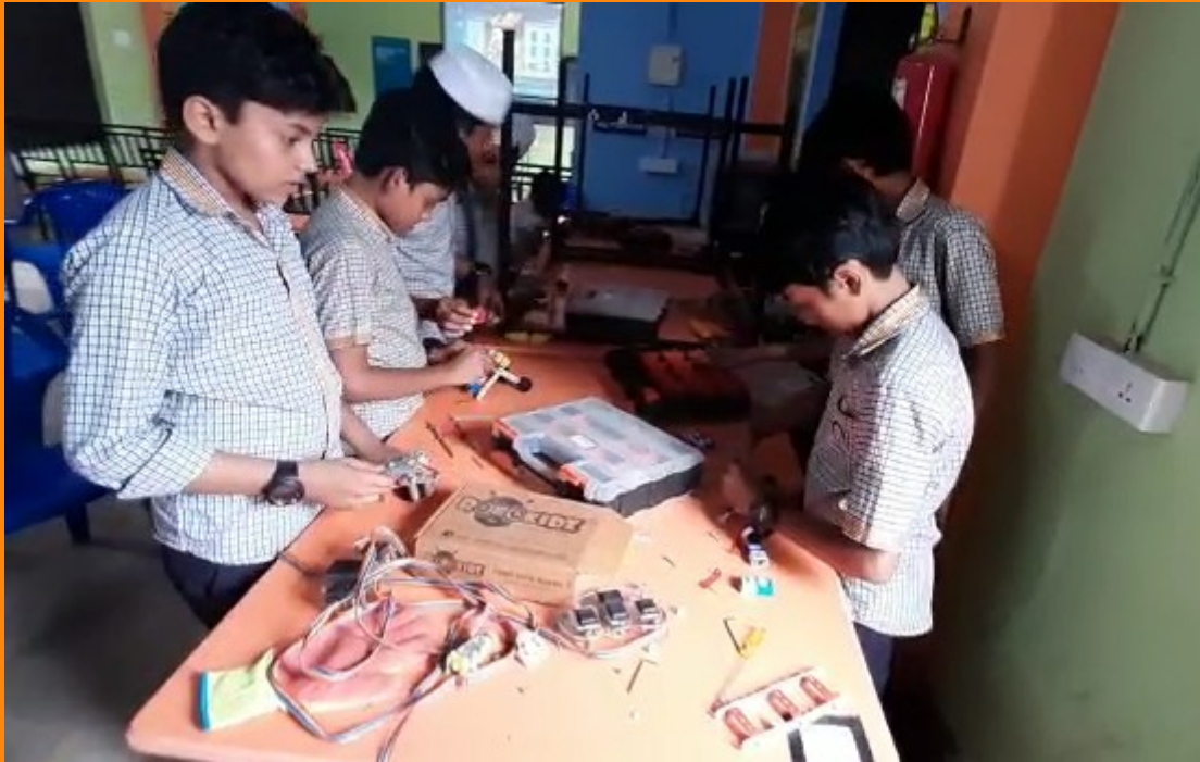
atal tinker lab