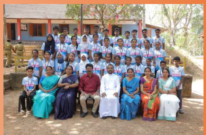
Little Kites Batch 2