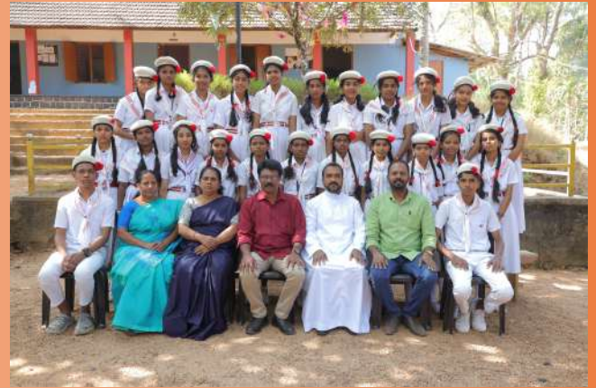
Junior Red Cross