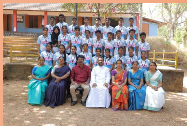
Little Kites Batch 1