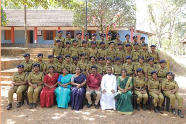
Student Police Cadet