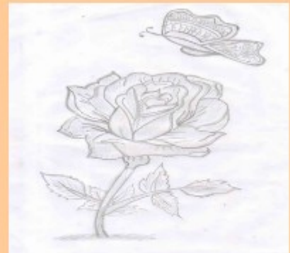
VEENA PRASAD STD: IX B