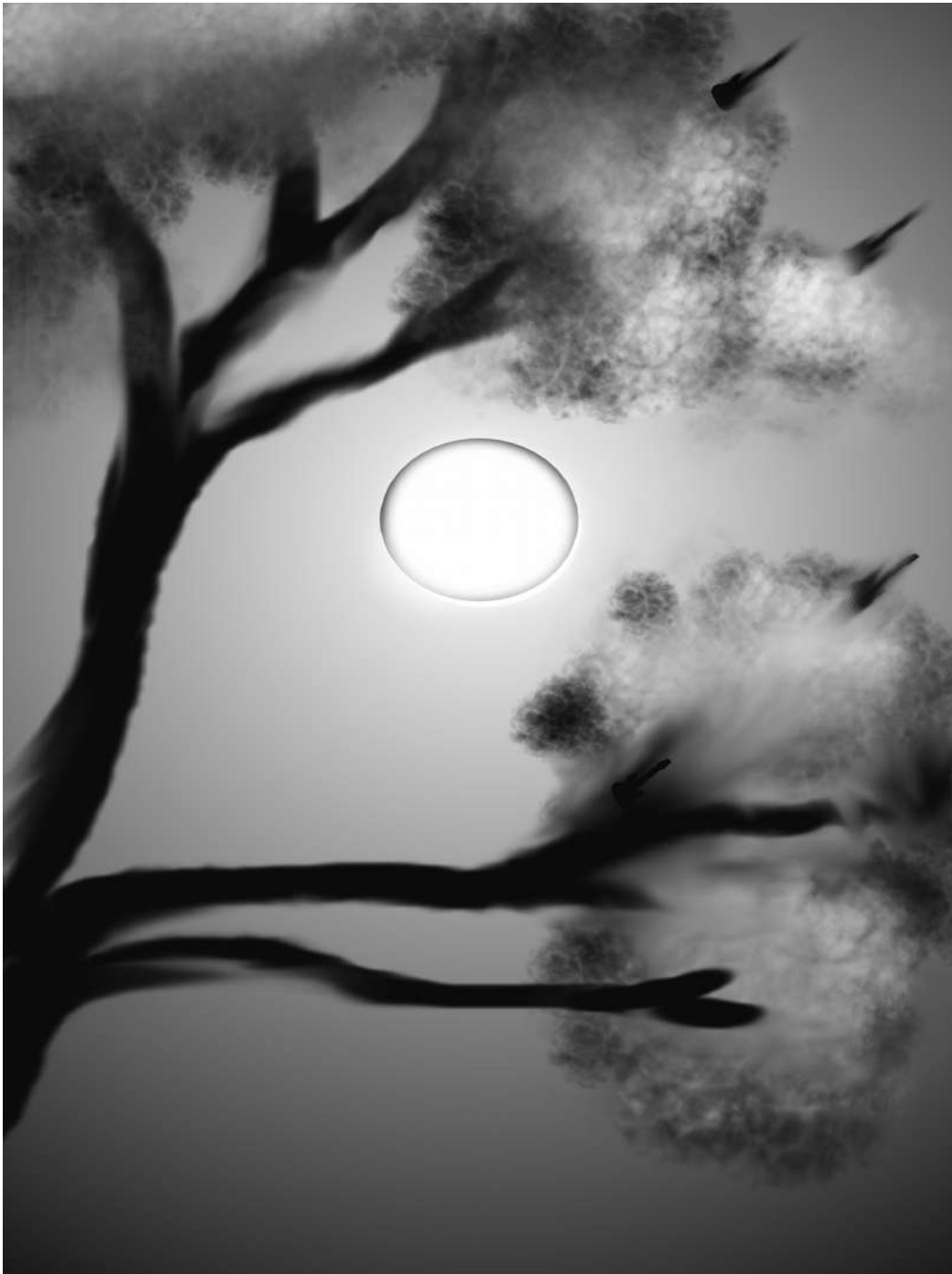
Sreebhadra K S (Nightmare)