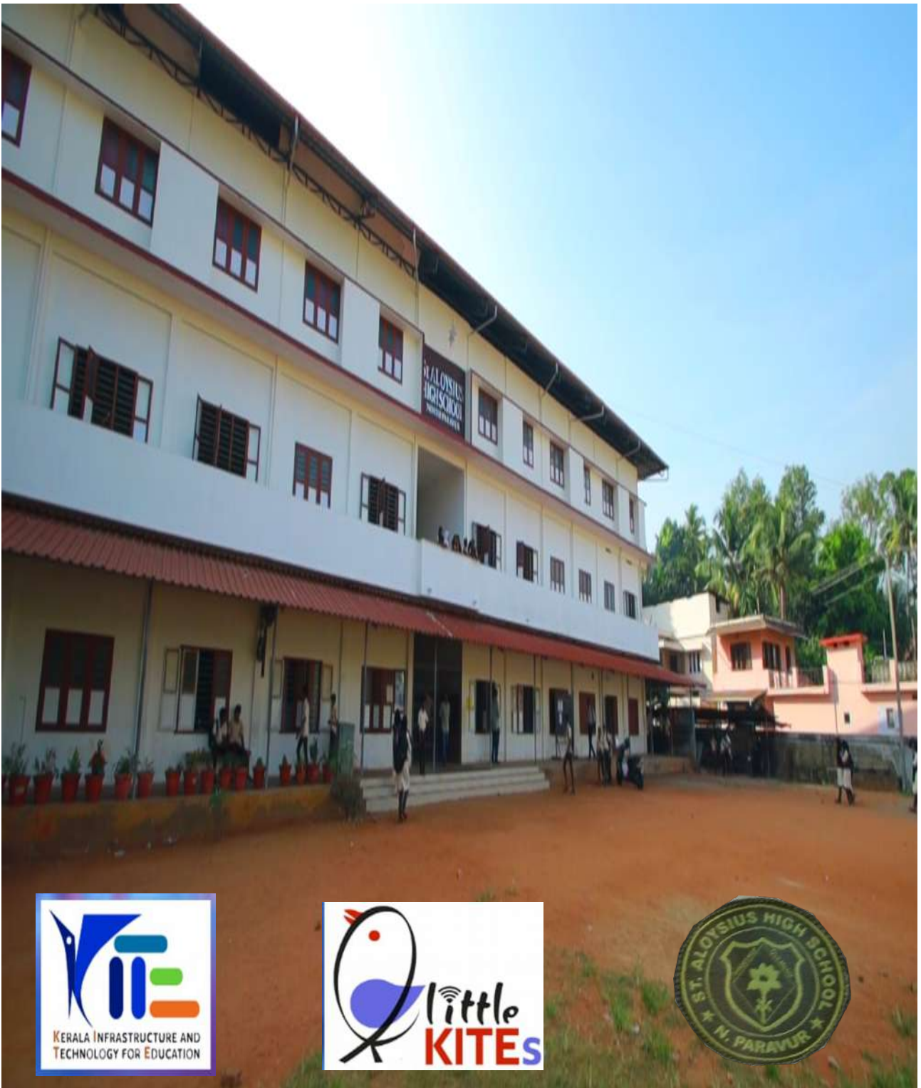
St. Aloysius. H. S. Sunrise