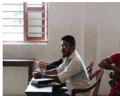
St. Aloysius. H. S. Sunrise