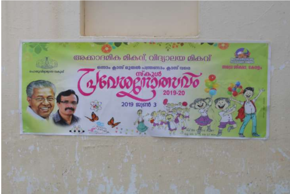
ST .THOMAS KOTTAKKAVU