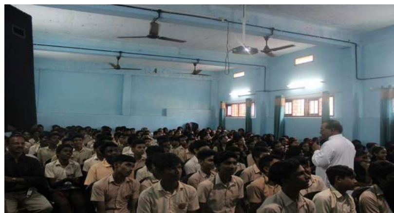
St. Aloysius. H. S. Sunrise