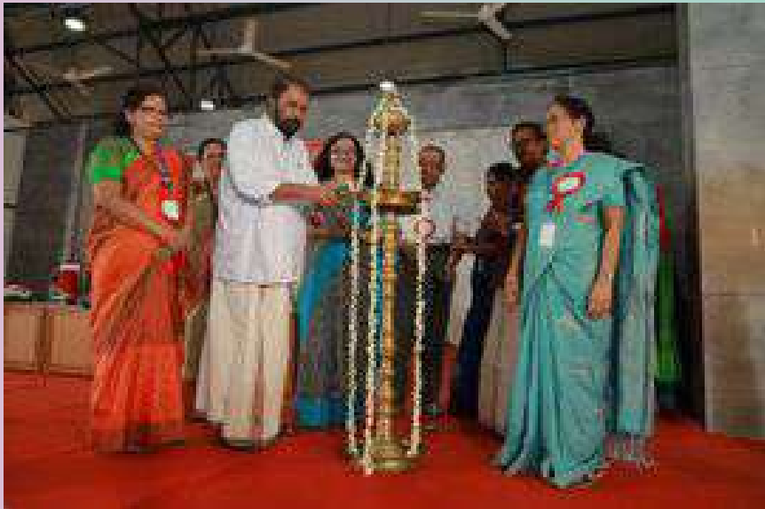
ബഹുമാനപ്പെട്ട വിദ്യാഭ്യാസ വകുപ്പു മന്ത്രി ശ്രീ. വി. ശിവൻകുട്ടി സഹവിദ്യാഭ്യാസത്തിന് ആരംഭം കുറിക്കുന്നു.