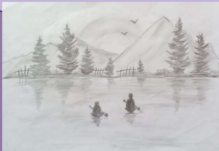
VAIGA SANTHOSH VII B