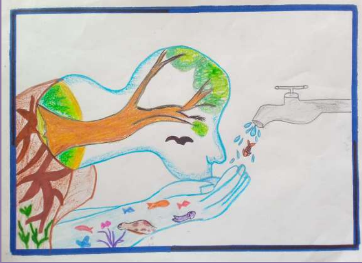
ADHYALAKSHMI K V VII B