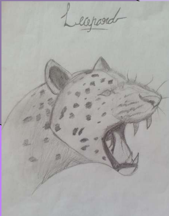
ZAHWA VI B