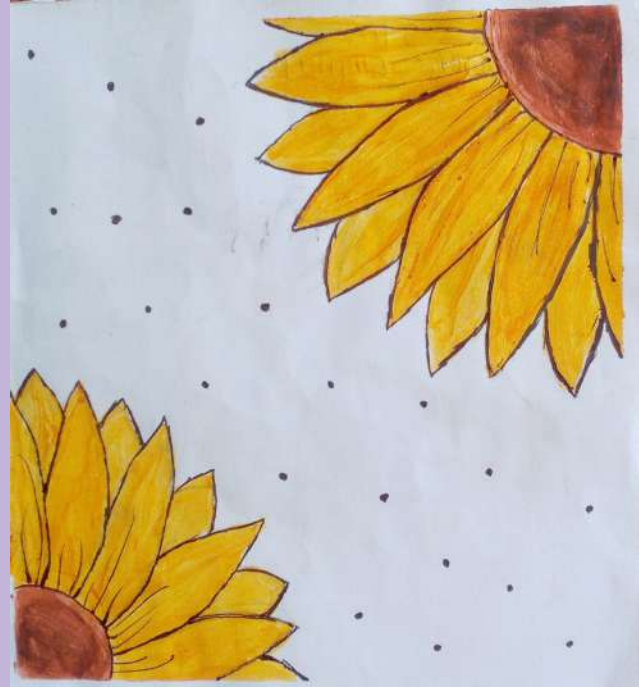
FATHIMA ZAMRIN VII B