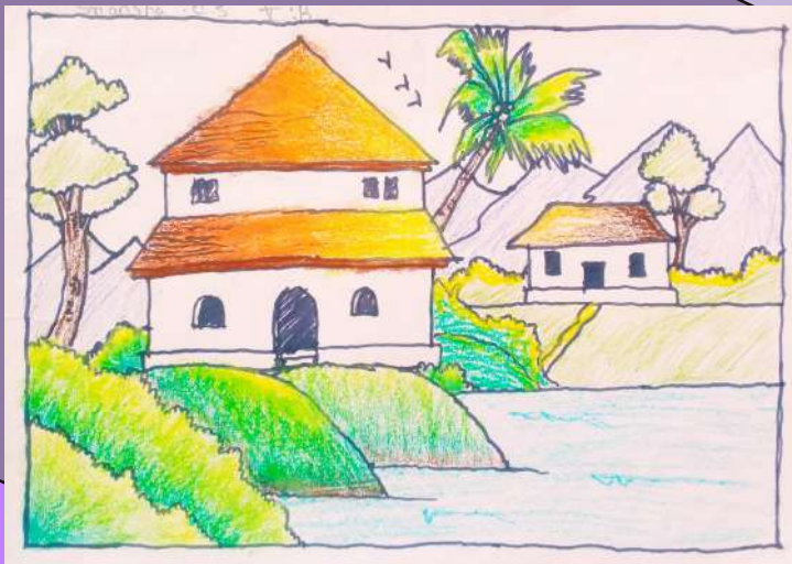
SRI ANSHA C S V B