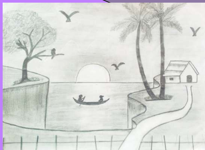
NAZLIN K N VI B