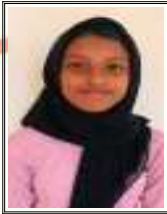
AFLA K 6 C

കുറച്ച കാലങ്ങൾക്ക് മുൻപ്, ഒരു നാട്ടിൽ കുറച്ച കടൽ സഞ്ചാരികൾ എത്തിച്ചേർന്നു . കടലിൽ സഞ്ചരിച്ച് പുതിയ അറിവുകൾ നേടുന്നവർ. അവർ ഗ്രാമീണരെ തങ്ങളോടൊപ്പം കടൽ വിസ്തൃതങ്ങൾ കാണാൻ ക്ഷണിച്ചു.പക്ഷെ അതിനു തയ്യാറായ കുറച്ചാളുകളെ ഉണ്ടായിരുന്നില്ല. പിന്നീട് അവരെല്ലാം ചേർന്ന് കടൽ കാഴ്ചകൾ കാണാനായി യാത്ര തിരിച്ചു.