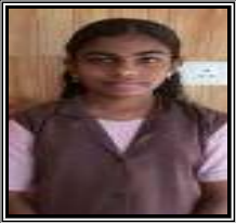
ARYA 8 J

ഓൺലൈൻ ക്ലാസുകൾ അതിനൊപ്പം വരുന്ന മറ്റു പല ലിങ്കുകളും എത്രത്തോളം അപകടകാരികളാണെന്ന് കുട്ടികളെ ബോധ്യപ്പെടുത്തുക.. തങ്ങൾ മുതിർന്നു കഴിഞ്ഞു എന്ന മിഥ്യയാരണ ആണ് പല കുമാരക്കാരെയും അപകടങ്ങളിൽ കൊണ്ടെത്തിക്കുന്നത്. "Generation gap" എന്ന് ഓമനപ്പെരിട്ട് വിളിച്ച അച്ഛനമ്മമാരുടെ ഉപദേശങ്ങൾ അവർ കുട്ടിൽ പറഞ്ഞു. ദുഷ്ടഫലമാക്കുന്ന ഗർഭത്തത്തിലേക്ക് അവർ താഴുകയും ചെയ്യുന്നു. ഇനി വരുന്ന തലമുറയുടെ സുരക്ഷയ്ക്കായി നമുക്ക് ഒരുങ്ങാം ഒരു നല്ല നാളെക്കായി നല്ല ചുവടുകൾ മാത്രം പിന്തുടരാം.