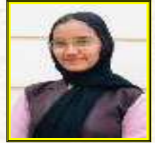
ALVAFA K 10 B

വരും തലമുറകൾക്കായി പുത്തൻ ഉഷസ്സായി പ്രശോഭിക്കാൻ നിങ്ങൾ ആവണം പ്രചോദനം നിങ്ങൾ ആവണം സാക്ഷി