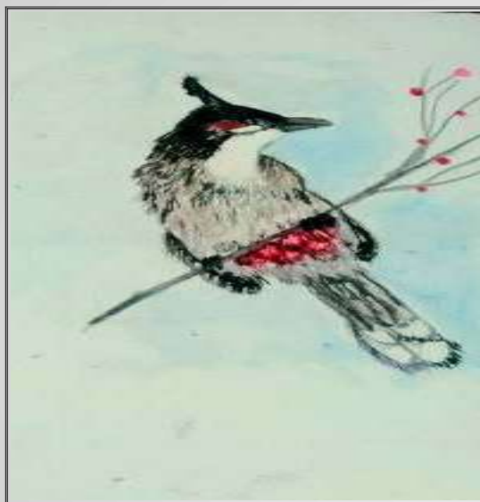
arya a 8 j