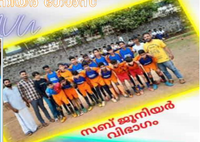
സബ് ജൂനിയർ വിഭാഗം