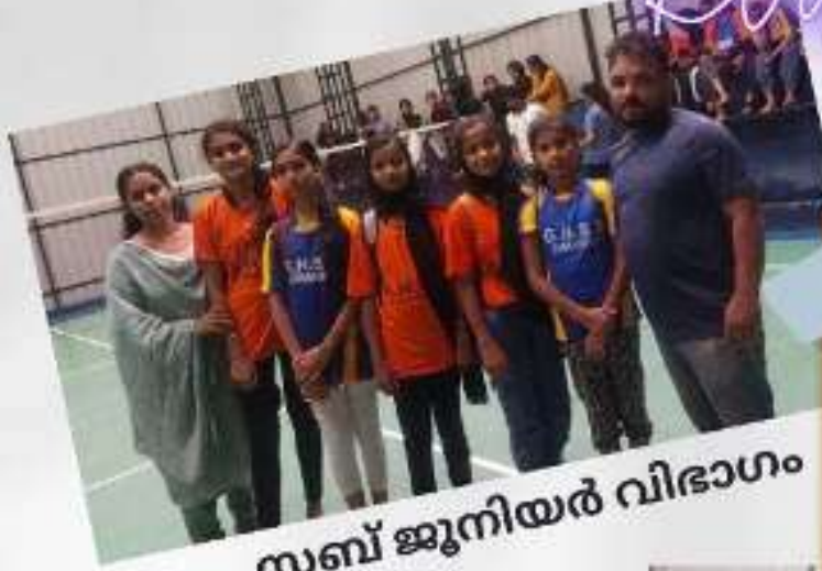
സബ് ജൂനിയർ വിഭാഗം