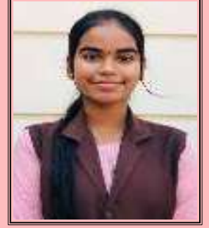
Ardra P 9 A

के लिए? कोई नहीं! ये सब उसको पता है पर वह कभी हरती नहीं । क्योंकि वह है एक नारी शक्ति का प्रतिक!