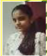
Adrija 8 F

ഏലംകുളം എന്ന സ്ഥലനാമം വന്നതിനെക്കുറിച്ച് അന്വേഷിക്കുമ്പോൾ ആ വാക്കിലുള്ള എലം . കുളം എന്നിവയുമാണെന്നും സ്ഥലപ്പേരിന് ബന്ധമില്ല എന്നാണ് മനസ്സിലാകുന്നത്. ഇതിന് ആസ്പദമായുള്ള എടുത്തു പറയത്തക്ക വലിയ കുളം ഇവിടെ ഇല്ല. ഏലംകുളം മന എന്ന വലിയ തണിക്കൂടും ബന്ധിന്റെ പേരുമായി ബന്ധപ്പെട്ടാണ് ഈ പ്രദേശം ഏലംകുളം എന്നറിയാൻ തുടങ്ങിയത് എന്നാണ് അറിയാൻ കഴിയുന്നത്. സമീപ പ്രദേശമായ മുത്തുകുറുശ്ശിക്ക് ആ പേര് വന്നത് മണ്ണാർക്കാട് നിന്ന് അതികൂടുംബകായ മുത്തുകുറുശ്ശി നിന്ന് അതികൂടുംബകായ മുത്തുകുറുശ്ശി മനക്കാർ ഇവിടെക്ക് വന്നതിനെ അടയാളമാണ്.