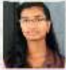
നീലസു എ നീ