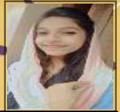
അഫ്സലാ 9 A

അവളുടെ കൈകളിൽ നിന്ന് വീണ പാത്രത്തിന്റെ ശബ്ദം കേട്ടപ്പോഴാണ് അവൾ തന്റെ ഭൂതകാല ഓർമ്മകളിൽ നിന്ന് മടങ്ങി വന്നത് . "അമ്മേ എനിക്ക് വിശക്കുന്നു "