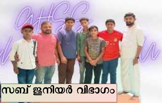
സബ് ജൂനിയർ വിഭാഗം

പെരിന്തൽമണ്ണ സബ്ജില്ല ബാഡ്മിൻറൻ മത്സരത്തിൽ ജൂനിയർ വിഭാഗം ഒന്നാം സ്ഥാനവും സബ്ജൂനിയർ വിഭാഗം രണ്ടാംസ്ഥാനവും കൈവരിച്ചു