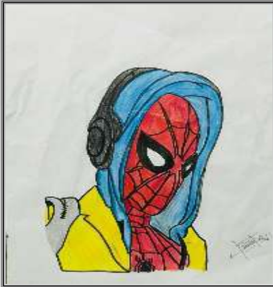
Abu RAHFEES 9 A