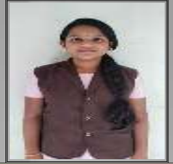
Chandra theertha 10 A