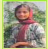
Jamshiya 9 B