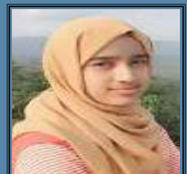
ZOHA K 10 D