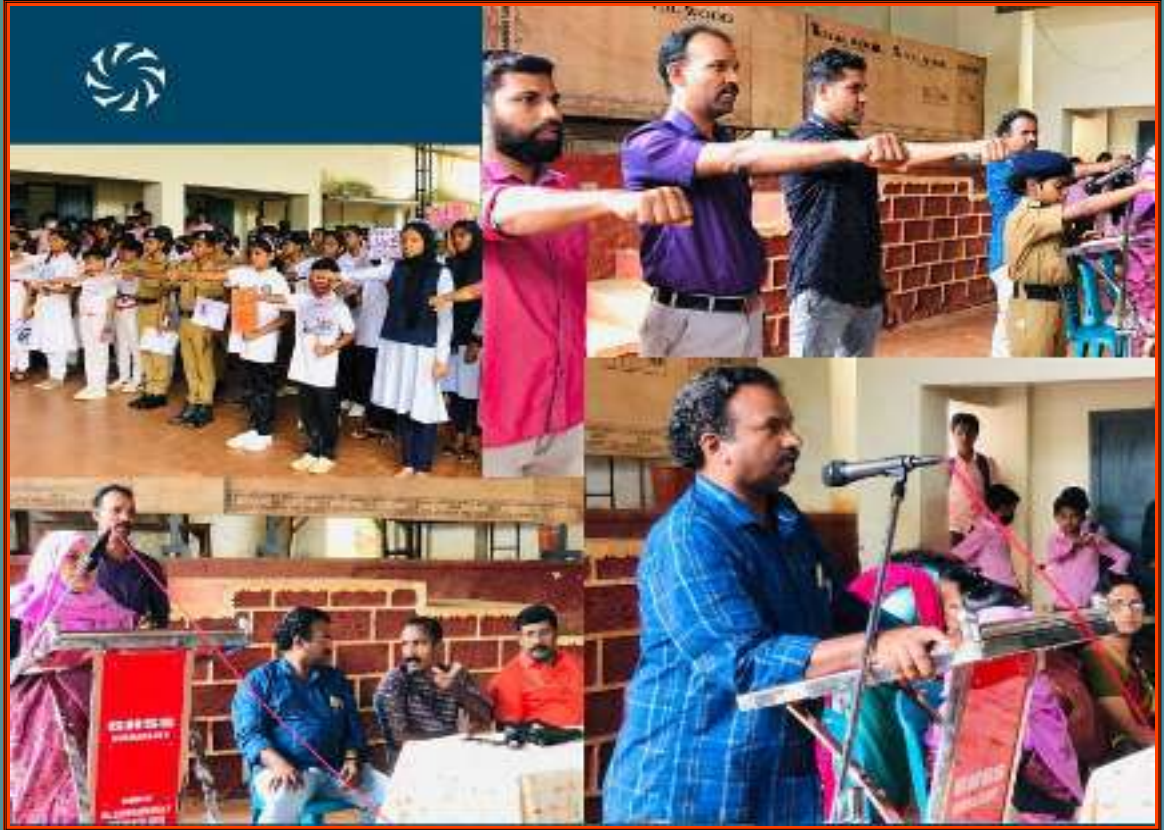
ലഹരി വിരുദ്ധ ക്യാമ്പൻ