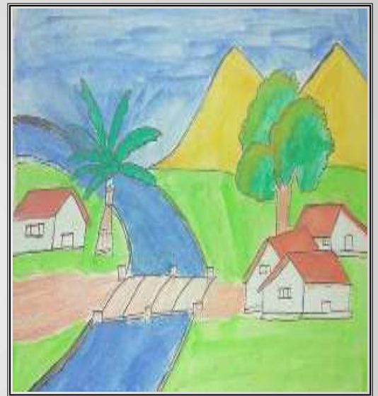
devashri m 8i