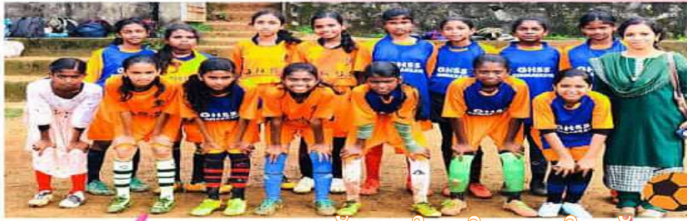
സബ് ജൂനിയർ ഗേൾസ്