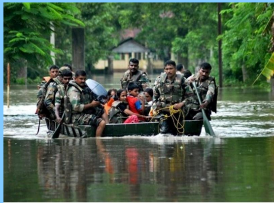
രക്ഷിക്കാം നമ്മുടെ കേരളത്തെ...

വീടും, ജീവിതവും. മഴ വന്നത് ഒരു കാലനെ പ്പോലെ. മഴ കൊണ്ടു പോയത് എത്രയോ പേരുടെ ജീവൻ . കേരളം അന്നാണ് പ്രളയ കേരളത്തെ കണ്ടത്. അത് കേരളത്തെ നശിപ്പിച്ചു. കോടി-കണക്കിന് ജീവൻ നശിച്ചു. ആ പ്രളയത്തിലൂടെ കേരളം പാടം പഠിച്ചു. അന്ന് ജാതി മതം അങ്ങനെ യൊന്നും ഉണ്ടായിരുന്നില്ല. എല്ലാവരും ഒരുമിച്ചായിരുന്നു കഴിഞ്ഞിരുന്നത്. അന്ന് അവരൊക്കെ ഒറ്റക്കെട്ടായിരുന്നു. അവരെ രക്ഷിക്കാൻ വന്നത് നിരവദി പോലീസ് കാരും ലൈഫ് ഗാർഡ്സും. ഇന്ത്യൻ ആർമിയും. അവർ രക്ഷിച്ചു കേരളത്തെ എന്ന് പറയാം. എല്ലാവർക്കും ഒരു പാഠമാണ് ഈ പ്രളയം