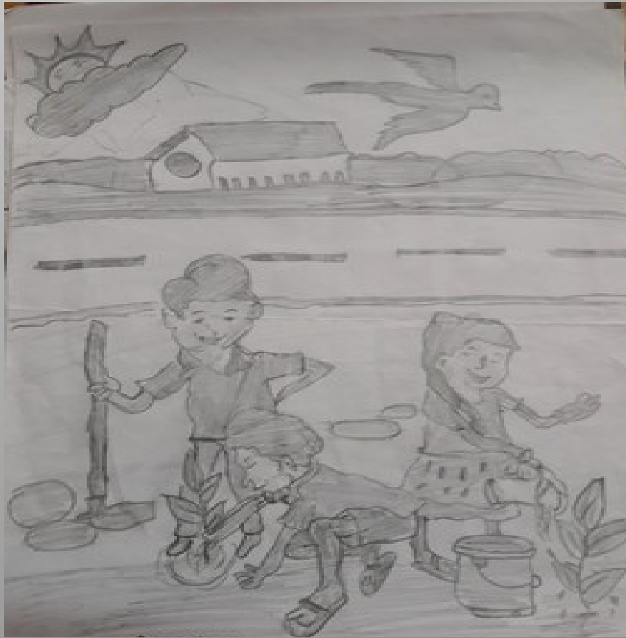
MEHAROOBA 9 B