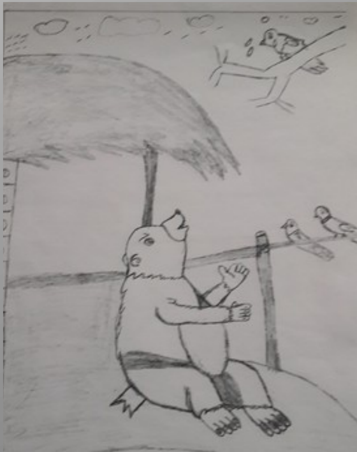
DILJITH 10 B