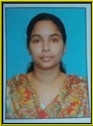
പ്രിയ ജോൺ കൈറ്റ് മിസുസ്

കൊല്ലം മോഡൽ ബോയ്സ് ഹൈസ്കൂളിലെ കുട്ടികളുടെയും അധ്യാപകരുടെയും സർഗ്ഗ സൃഷ്ടികളാണ് മഴവില്ലിലെ വർണ്ണങ്ങളായി വിരിഞ്ഞിരിക്കുന്നത് അതു ഡിജിറ്റൽ ആയപ്പോൾ കാലത്തിനൊപ്പമുള്ള കൈപിടിക്കലുമായി. ഞങ്ങളുടെ ഈ എളിയ സംരഭത്തിൽ സഹകരിച്ച എല്ലാ മഹദ് വ്യക്തികൾക്കും ഈ അവസരത്തിൽ ഹൃദയത്തിന്റെ ഭാഷയിൽ നന്ദി അർപ്പിക്കുന്നു.