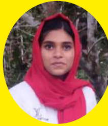
മിൻഹ ഒ പി