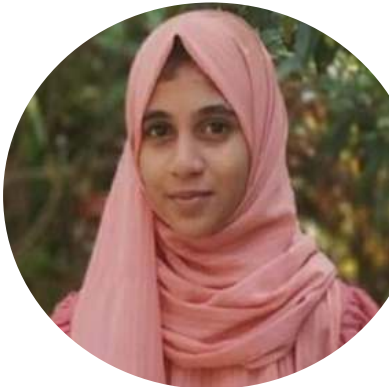
ഖദീജ ബില്ല 9 ഐ

മാർച്ചിലെ വാർഷിക പരീക്ഷയും കഴിഞ്ഞ് രക്ഷിതാക്കളോടൊപ്പം ബന്ധുവിട് സന്ദർശനവും വിനോദയാത്രയും കൂട്ടുകാരോടൊത്തുള്ള വിനോദവും എല്ലാം പ്രതീക്ഷിച്ച കുട്ടികൾക്ക് ലോക്ക് ഡൗൺ ഒരു തിരാനഷ്ടമാണ്. ഓൺലൈൻ ക്ലാസുകളും കുട്ടികൾ എങ്ങനെ സ്വീകരിച്ചുവന്നതും ചിന്തനീയമാണ്. സ്വന്തം വീടുകളിൽ അടച്ചുപൂട്ടി കഴിയുന്ന അവരുടെ മാനസികാവസ്ഥ വളരെ പരിതാപനായിരുന്നു. അതുപോലെ ഒന്നര വർഷക്കാലത്തെ സ്കൂൾ അടച്ചിടൽ കുട്ടികളുടെ സാമൂഹിക ഇടപെടലും ശാരീരിക ക്ഷമതയിലും വലിയ വിടവാണ് വരുത്തിയത് എന്നാൽ എല്ലാവരുടെയും നിരന്തരമായ പരിശ്രമം മൂലം കുട്ടികൾക്ക് അവരുടെ പഴയ ജീവിതത്തിലേക്ക് മടങ്ങാൻ സാധിച്ചിട്ടുണ്ടെന്നതിൽ ആശ്വാസം കണ്ടെത്താം.