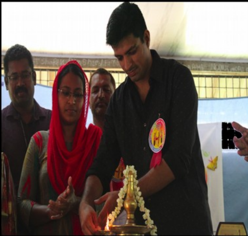
Aslaf Parakkedan District panchayath member