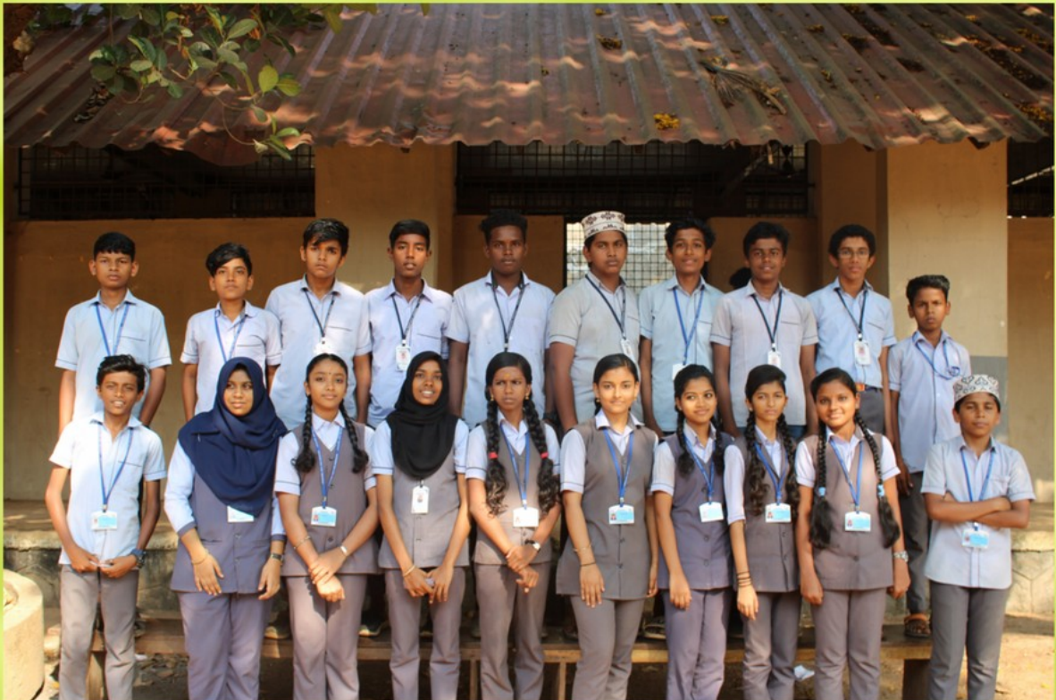
LITTLE KITE BATCH 2019-2021