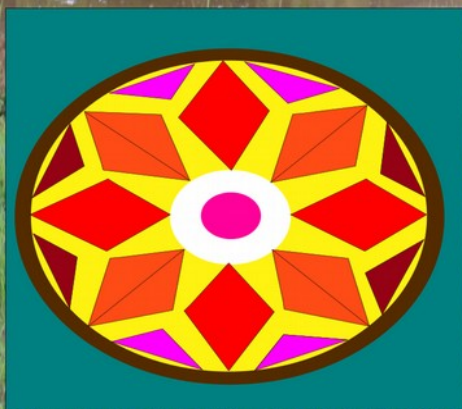
3 rd Prize-Nikhil Anilkumar