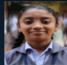
Devu V.R IX B

The moon cheer to the sea, And the sea will happy the presence of moon. The sea was a wonder , And the sea was a great.