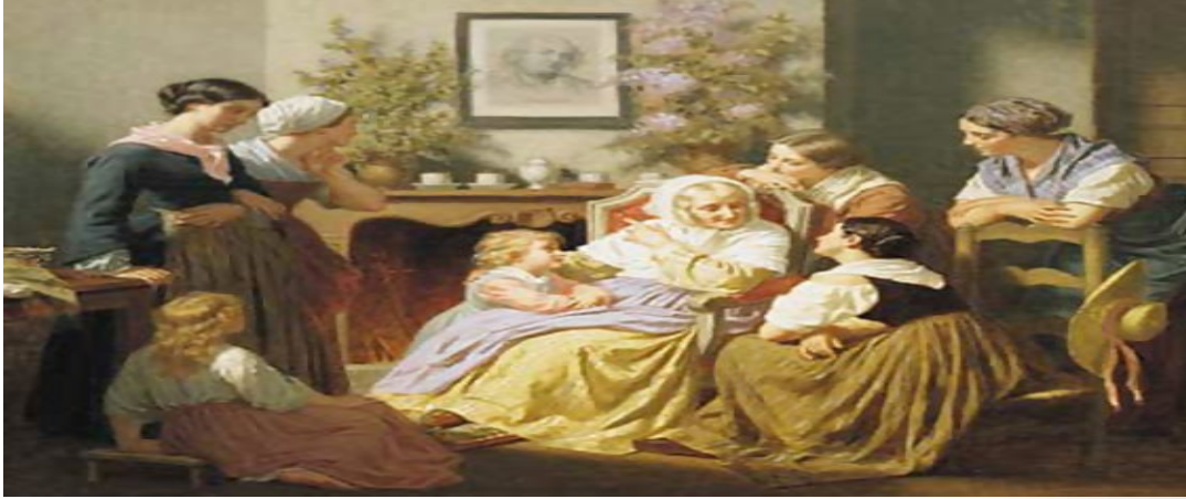
ഒരു മുത്തശ്ശി കഥ

രസകരങ്ങളായ കഥകളുടെ അക്ഷയപാത്രമാണ് മുതശശി. എത്ര പറഞ്ഞാലും അവസാനികാതവിധം ധാരാളം കഥകൾ മുത്തശ്ശികറിയാം . ഒരു ദിവസം മുത്തശ്ശി പറഞ്ഞത്, മറ്റൊരു മുത്തശ്ശിയുടെ കഥയാണ്. കുടികളെലാവരും അരികത് ശ്യാസമടകിപിടിചിരുന്ന കഥകേൾക്കാൻ. ഓരോ വാചകങ്ങൾ അവസാനിക്കുമ്പോഴും അവർ മുളികൊണ്ടിരുന്ന . ഒരു മഞ്ഞുകാലമായിരുന്ന അത്. ഇളംവെയിലേകാൻ ആ മുത്തശ്ശിക്ക് വല്ലാത്ത ആഗൃഹം തോന്നി . തുനികുത്തന്നുള്ള കീറിയവസ്തുങ്ങളുമെടുത്ത്, സൂചിയും നൂലുമായി മുത്തശ്ശി കിണറിന്റെ വായ്ക്കല്ലിന്റേമൽ ചെന്നിരുന്നു. തെങ്ങിൻതലപ്പുകളുടേയും തരിശുമരത്തിന്റേറയും ഇടയിലൂടെ അവിടേയ്ക്ക് സൂര്യപ്രകാശം നല്ലവണ്ണം ഊർന്നുവീഴുന്നുണ്ട്. അവിടെയിരുന്ന് മുത്തശ്ശി ഇളംവെയിൽ കായുകയും കീറിയ ഇണി ഇന്നിക്കുത്തുകയും ചെയ്തുകൊണ്ടുവരുന്നു.