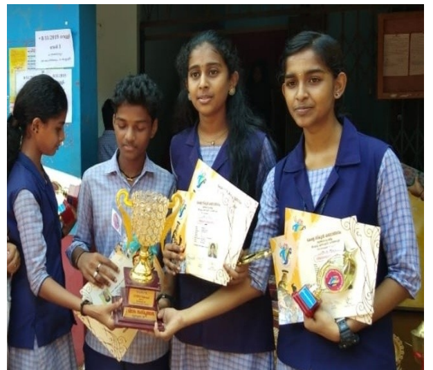
സംസ്കൃതം സംഘഗാനം-എ ഗ്രേഡ്