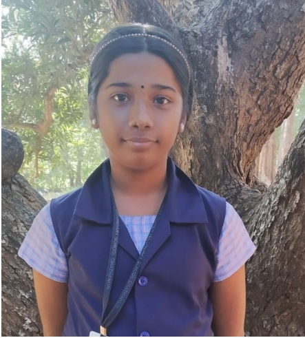
ഗായത്രി-ന്യൂ മാത് സ് എക്ലാം