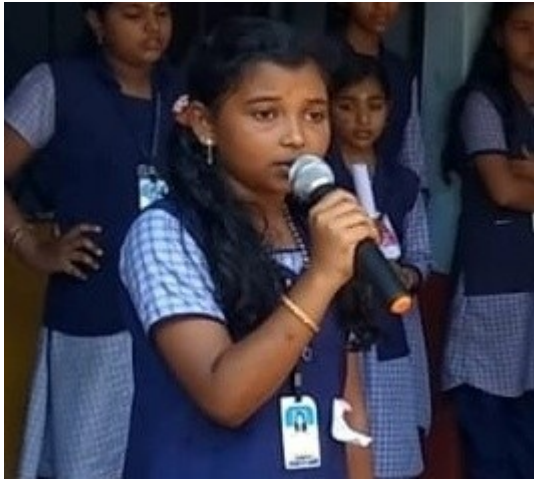
മേധ-മലയാളം പദ്യം ചൊല്ലൽ