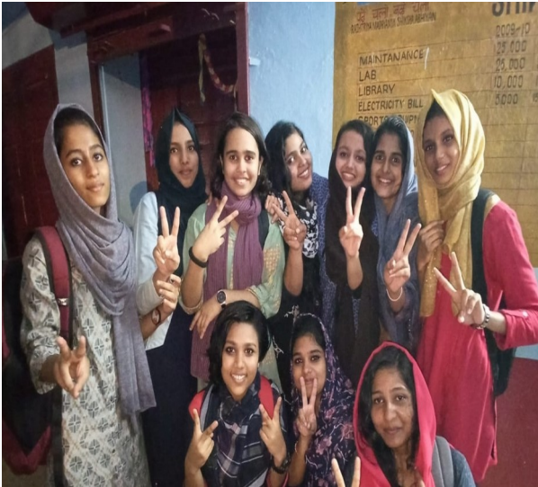
ഇംഗ്ലീഷ് സ് കിറ്റ്-സെക്കന്റ് എ ഗ്രേഡ്