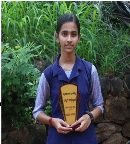
ഉണ്ണിമയ-സബ് ജില്ലാ വാർത്താവായന