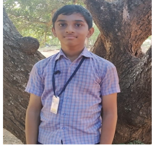
ആദർശ്-ന്യൂ മാത് സ് എക്ലാം