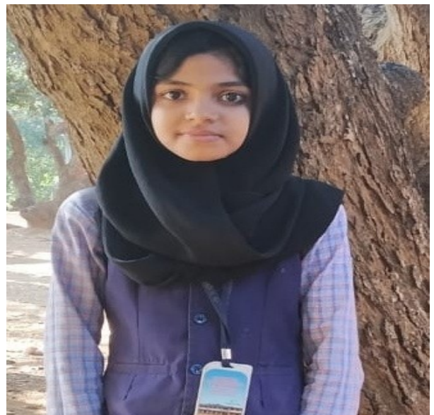
ഫർഹ.പി.ഹംസ-മാത് സ് ടാലന്റ് സർച്ച് എക്സാം