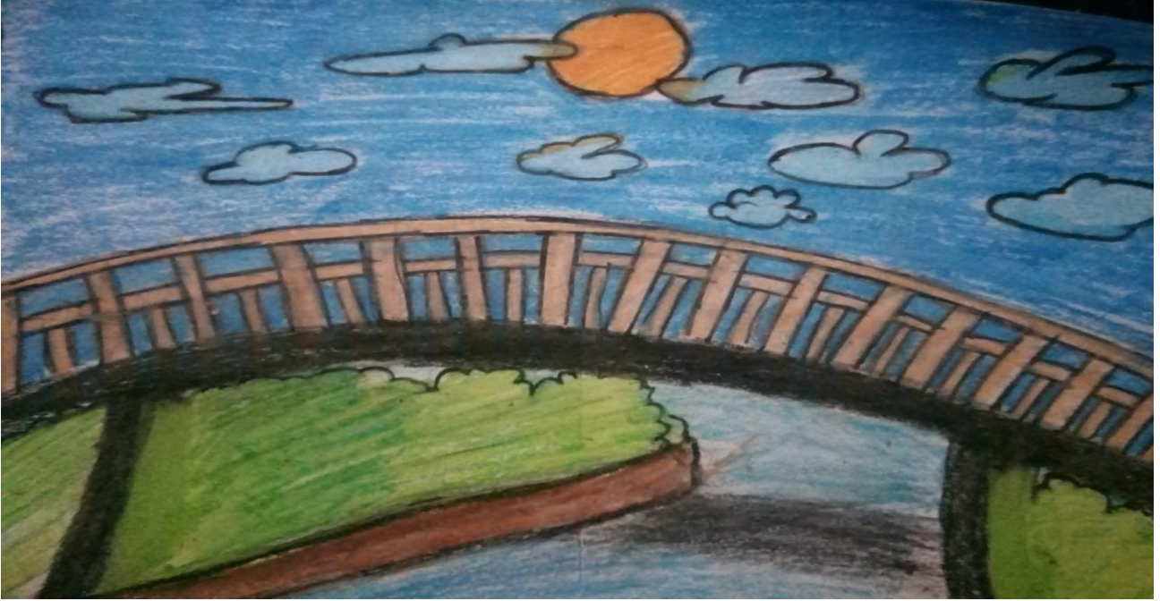
Fayas – 9 B