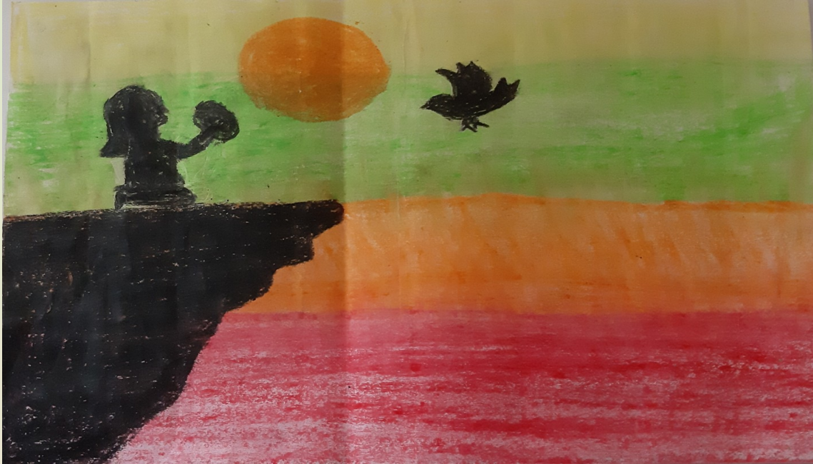
Daya M D 9 D