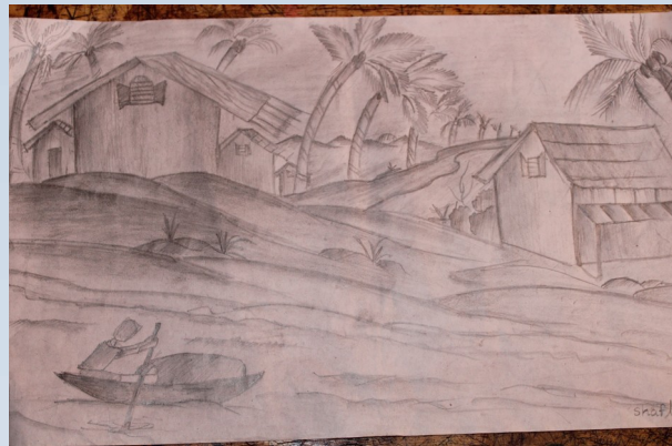
Shafla KM (9A)