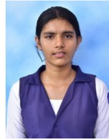
തയ്യാറാക്കിയത് വർഷ പി

പറഞ്ഞ രാശിയിൽ നിലവിലുള്ള കൊളുത്തി കൊടിയിലയിൽ വിത്തിട്ട് തറയിൽ കുഴിച്ചു മുടുന്നു.