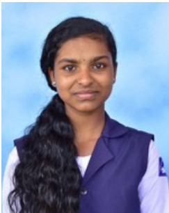
തയ്യാറാക്കിയത് അക്ഷയ എ

1763 ൽ ബദനൂർ ആക്രമിച്ച് നായ്ക്കന്മാരുടെ ഭരണത്തിന് അന്ത്യം കുറിച്ച് ഹൈദരാലി 1765 ൽ കര, കടൽ, മാർഗ്ഗങ്ങളിലൂടെ തെക്കോട്ട് നീങ്ങുകയും കാസർഗോഡൻ പ്രദേശങ്ങൾ പിടിച്ചെടുക്കുകയും ചെയ്തു. തുടർന്ന് ടിപ്പുനടത്തിയ പടയോട്ടം കാസർഗോഡിനെ മൈസൂരിന്റേ ഭാഗമാക്കി. ബേക്കലിൽ ടിപ്പുവിന്റെ ഭരണ കേന്ദ്രം സ്ഥാപിച്ചു. ബേക്കലായിരുന്നു താവളം .ടിപ്പുവിന് എതിരായി കലാപം നടത്തിയ നീലേശ്വരം രാജാവിനെ ബേക്കലിൽ 1787 ൽ തൂക്കിലേറ്റിയതിന് തെളിവുകളുണ്ട്. 1792 ൽ നടന്ന മൂന്നാം മൈസൂർ യുദ്ധത്തിൽ പരാജയപ്പെട്ട ടിപ്പു മലബാർ ഉൾപ്പെടെ തന്റെ നിയന്ത്രണത്തിലുണ്ടായിരുന്ന പ്രദേശങ്ങൾ ഇംഗ്ലീഷ് കമ്പനിക്ക് നൽകി ഏങ്കിലും ബേക്കൽ ഉൾപ്പെടെയുള്ള കാസർഗോഡ് പ്രദേശം വിട്ടുകൊടുക്കുവാൻ തയ്യാറായിരുന്നില്ല. ഇതിന് പ്രധാന കാരണം ബേക്കലിന്റെ വാണിജ്യ പ്രാധാന്യം തന്നെയാണ്. ടിപ്പുവിന്റെ വാണിജ്യ സാമ്രാജ്യത്തിലെ പ്രധാന കേന്ദ്രം ബേക്കൽ തുറമുഖമായിരുന്നു. വാണിജ്യ വിളകൾ വ്യാപകമായതോടെ അതുമായി ബന്ധപ്പെട്ട് കച്ചവടം വളർന്നുവന്നു. ഉൽപ്പന്നങ്ങളുടെ കയറ്റുമതിയും ഇറക്കുമതിയും വർദ്ധിച്ചു. തീര പ്രദേശങ്ങളിൽ തുറമുഖങ്ങൾ ഉയർന്നു വന്നു.1799 ൽ ശ്രീരംഗപട്ടണത്തുവെച്ച് ബ്രിട്ടീഷുകാരുമായി ഏറ്റുമുട്ടി ടിപ്പു മരിച്ചു വീണപ്പോൾ ബേക്കൽ ഇംഗ്ലീഷ് ഈസ്റ്റ് ഇന്ത്യാ കമ്പനിയുടെ ഭാഗമായി മാറി. ഇംഗ്ലീഷ് ഈസ്റ്റ് ഇന്ത്യ കമ്പനിക്ക് ബേക്കലിന്റെ നിയന്ത്രണം ലഭിച്ചപ്പോൾ ആദ്യം ബോംബൈ പ്രസിഡൻസിലൂടെ കീഴിലായിരുന്ന ബേക്കൽ പ്രദേശം പിന്നീട് ദക്ഷിണ കാനടയിലെ ഒരു താലൂക്കായി മാറി.