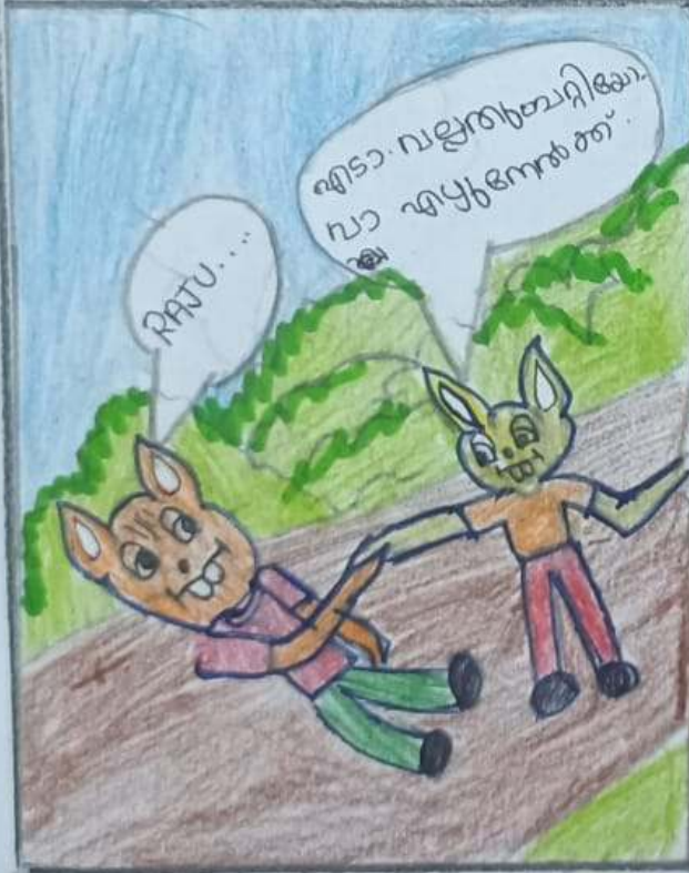
അന്യരായ ഉപയോഗത്തിൽ അന്യരായ സഹായം.