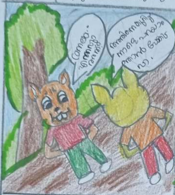
Դառարանի օգնականը Զեյնուբը: