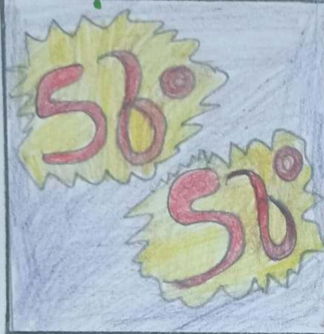
രാശി രാജ്യം അന്യരായ ശിക്ഷിതയ്ക്ക്.