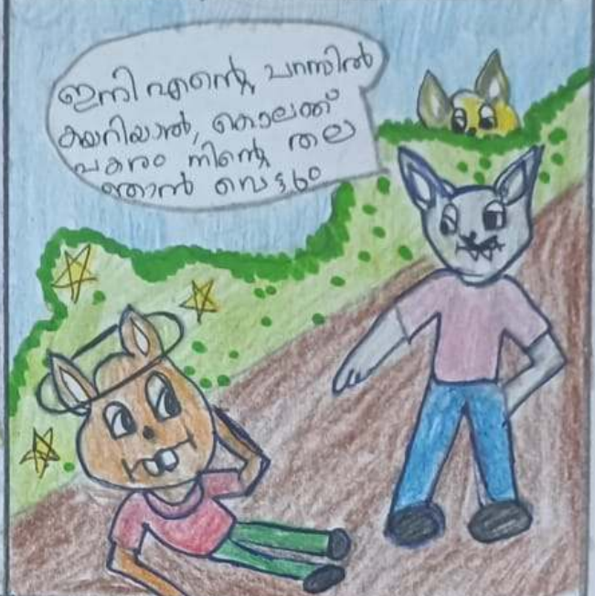
അന്യരായ, കൂടുതൽ രാജ്യം എല്ലാ ഉപയോഗത്തിൽ, കമ്മ്യൂണി.