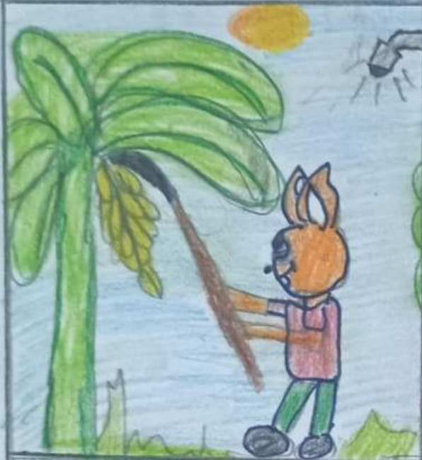
അമ്മൻ നീട്ടിൽ ചോരപ്പുഴ.