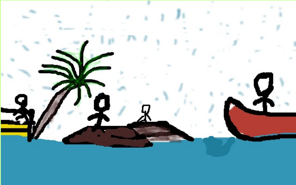
വര - അതുൽ പി പി

കൂട്ടം ജനങ്ങൾ അപ്പോൾ തന്നെ ഒഴിവായിപ്പോയി.എങ്കിലും ചിലർ മറ്റു ജോലി ചെയ്ത് കൃഷിപ്പണിയെടുത്ത് അധ്വാനിച്ച് അന്നത്തെ ചെലവിനായി ജീവിക്കുന്നവരാണ്. അവർ പട്ടിണി കിടന്നും ജന്മനാടിനെ വിട്ട് ഒരിടത്തേക്ക് പോകില്ലെന്നായി.ആ ദുഷ്ടരായ മനുഷ്യർ അവരെ മർദ്ദിച്ച് സ്വന്തം വീട്ടിൽ നിന്നും ഇറക്കിവിട്ടു. തുച്ഛമായി കിട്ടുന്ന പണത്തിൽ മിച്ചം വച്ച് ഉണ്ടാക്കിയെടുത്ത വീട് . അത് ചെറുതോ വലുതോ ആയിക്കൊള്ളട്ടെ. നഷ്ടപ്പെടുന്ന വേദന പറഞ്ഞറിയിക്കാനാവാത്തതാണ്.ഇപ്പോൾ ഞങ്ങൾ ഓർക്കുന്നു ആ വലിയ മനുഷ്യൻ ജീവിച്ചിരുന്നവെങ്കിൽ ഇത് സംഭവിക്കില്ലായിരുന്നുവെന്ന്.