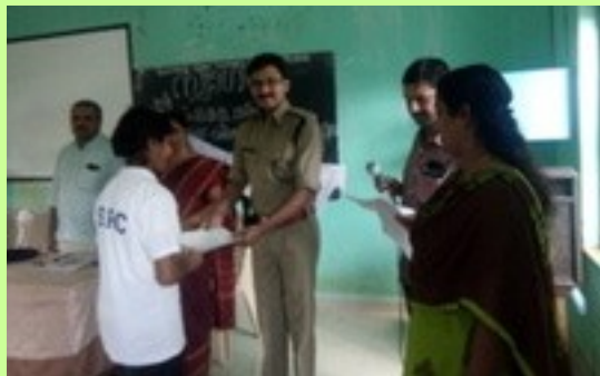
ഗവ.ഹയർ സെക്കന്ററി സ്കൂൾ കാട്ടിക്കുളം