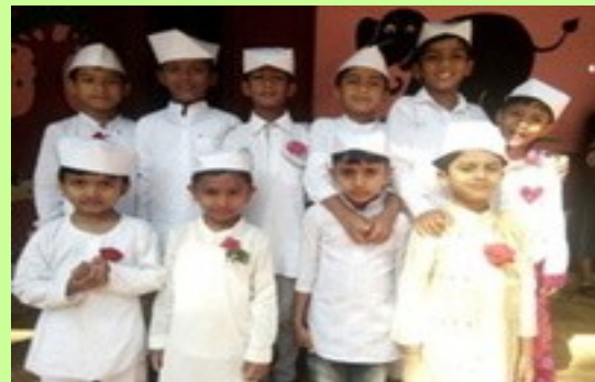
ഗവ.ഹയർ സെക്കന്ററി സ്കൂൾ കാട്ടിക്കുളം