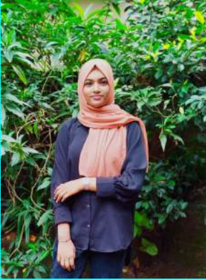
നദ മർവ കെ പി